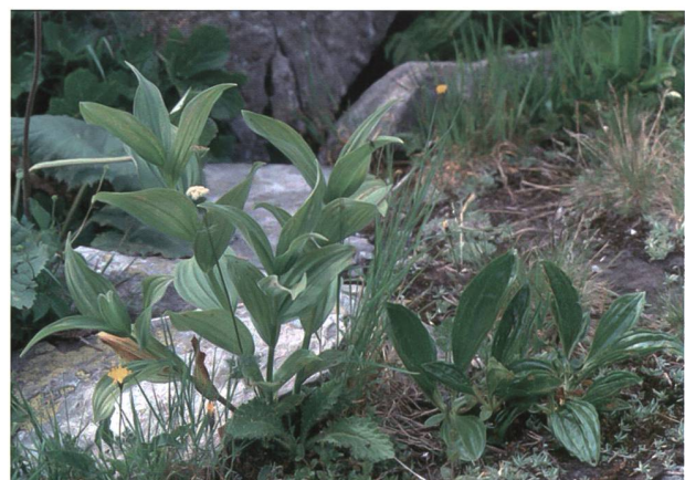
Figura 1: Le due piante giustapposte. A sinistra Veratrum album L., a destra foglie di Gentiana punctata L. (foto: R. Peduzzi).

Ancora oggi la radice di genziana costituisce l'ingrediente principale per molti digestivi, amari, liquori stomacali o aperitivi. Una possibile causa di "incidente" è quella riferita alla raccolta di radici e rizomi di veratro al posto di quelli di genziana. È importante segnalare