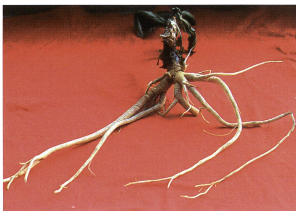
Figura 5: Rizoma e radici di Gentiana lutea L. (foto: R. Peduzzi).

Riferendoci nello specifico alle differenze fra V. album e G. lutea possiamo constatare che entrambe le specie presentano dei fusti sotterranei chiamati rizomi situati in concomitanza dell’apparato radicale. Il rizoma del veratro è breve, grosso (nei vecchi esemplari può raggiungere uno spessore di 3 cm), di colore scuro esternamente e biancastro all’interno (Fig. 4). La genziana presenta invece, nella parte superiore, un rizoma di color bruno e internamente giallo, mentre nella parte inferiore un numero limitato di radici secondarie (Fig. 5). Fra le caratteristiche più significative per il riconoscimento delle due specie, oltre al tipo di infiorescenza differente per colore e forma (Fig. 2 e Fig. 3) si segnala la presenza di foglie alterne, scabre al tatto e dal colore verde-grigiastro nel V. album e foglie opposte, con nervature gialle e prominenti sulla pagina inferiore della foglia di color verde-glaucio nella G. lutea (Mattiolo 2015; Lauber et al. 2012).