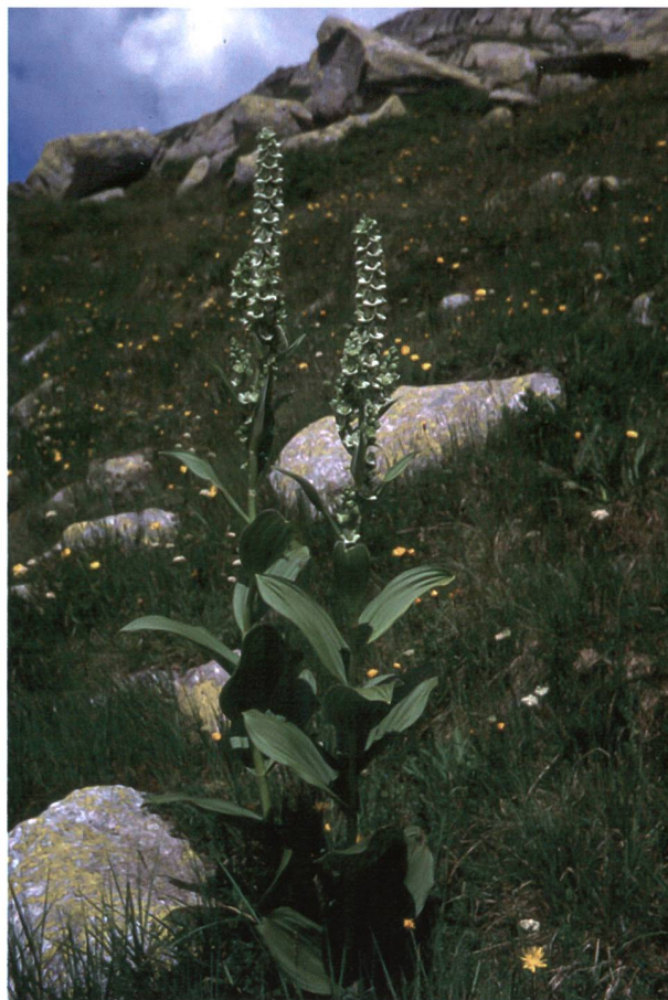
Figura 2: Infiorescenza di Veratrum album.

Numerosi studi su pazienti che hanno manifestato sintomi da intossicazione hanno reso possibile l'identificazione dei principi attivi più tossici del veratro, fra i quali vale la pena menzionare diversi tipi di alcaloidi raggruppati come protoveratrine (ProA, ProB), veratridina, cevadina, jervina (Grobosch et al. 2008).