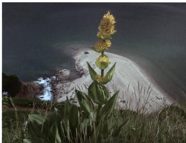
Figura 3: Infiorescenza di Gentiana lutea.

Secondo il Centro tossicologico di Zurigo gli alcaloidi di Veratrum album possono provocare vomito, diarrea, parestesie, oltre a disturbi al sistema cardiovascolare e all'apparato respiratorio. L'azione di questi principi attivi (soprattutto veratrina, protoveratrina e gemerina) è ritenuta inoltre responsabile della tossicità sull'apparato renale, sulla muscolatura liscia, sul sistema nervoso e sui centri per la regolazione termica del corpo (Peduzzi & Cerny 2006). Altri autori hanno messo in evidenza il potere teratogeno degli alcaloidi steroidei del genere Veratrum isolati da V. parviflorum (Anwar et al. 2018). I sintomi sopracitati si possono in effetti ritrovare anche in alcune documentazioni storiche. Un esempio interessante è un articolo del 1915 in cui vennero de-