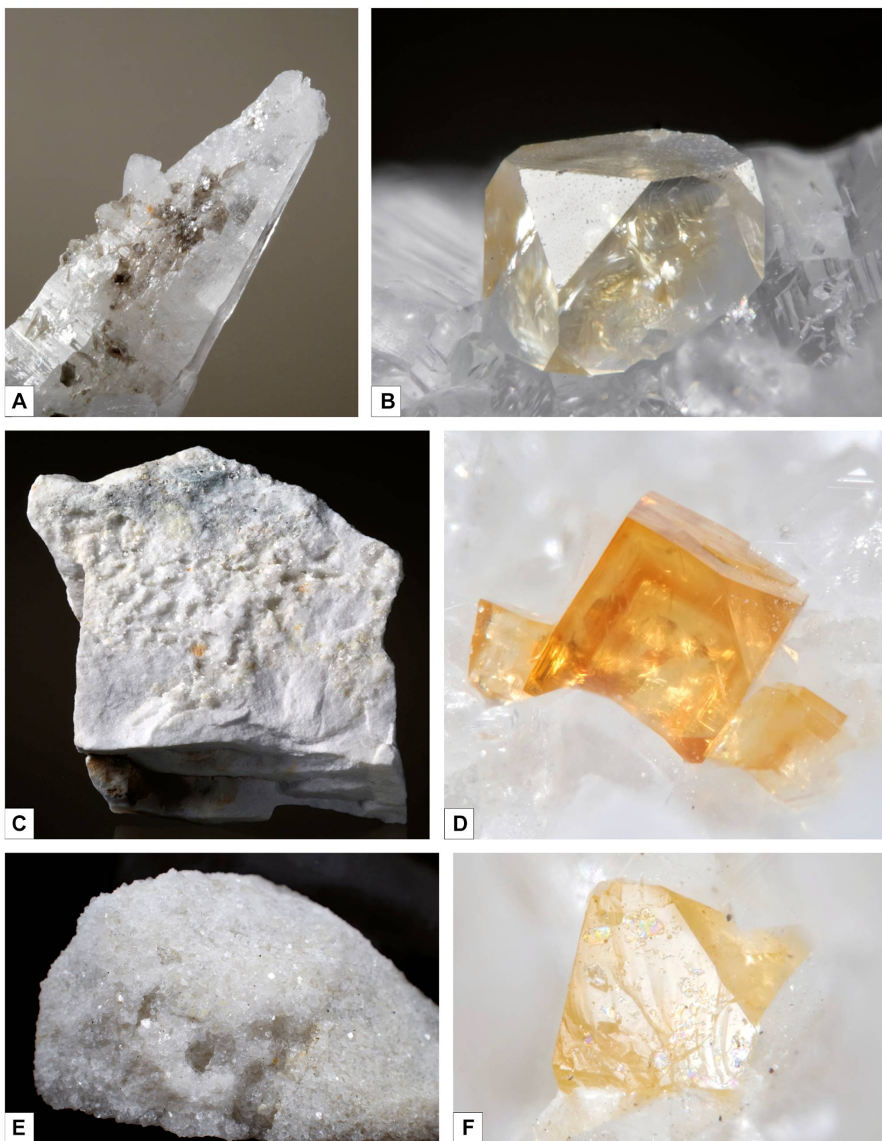
Figura 2: (A) cristallo di quarzo dal Pizzo Fiorina, reperto 1 (4 x 2 cm). Al centro nella parte superiore s'intravede un cristallo arancione di svanbergite-goyazite. (B) uno dei cristalli presenti sul quarzo (larghezza del campo inquadrato 0.8 mm). (C) campione di marmo dolomitico dal Ri della Foppa, 6 x 5 cm. (D) cristallo arancione di goyazite (larghezza del campo inquadrato 0.9 mm). (E) marmo dolomitico dal Passo Vanit, reperto 3 (3 x 2 cm). (F) l'unico cristallo arancione di svanbergite presente sul marmo (larghezza del campo inquadrato 0.8 mm).