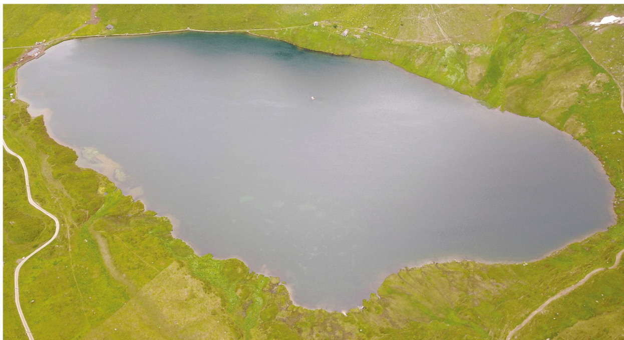
Figura 1: Foto aerea con drone del Lago di Cadagno nel luglio del 2018, lungo la sponda sud è intuibile la presenza di vegetazione acquatica sommersa.

al., 2011-2012b) ma anche di fitoflagellati del genere Cryptomonas (Camacho et al., 2001) o di cianobatteri, entrambi contenenti ficocianine. La produzione primaria del chemocline (10-14 m) contribuisce in maniera importante, fino al 50% del totale, al bilancio e alle possibilità di trasferimento di energia dal monimolimnio e chemocline verso il mixolimnio (Bertoni & Callieri, 1999; Camacho et al. 2001). Il ruolo e la composizione della comunità dei microorganismi fotosintetici aerobici sopra la fascia batterica è un aspetto ancora da approfondire.