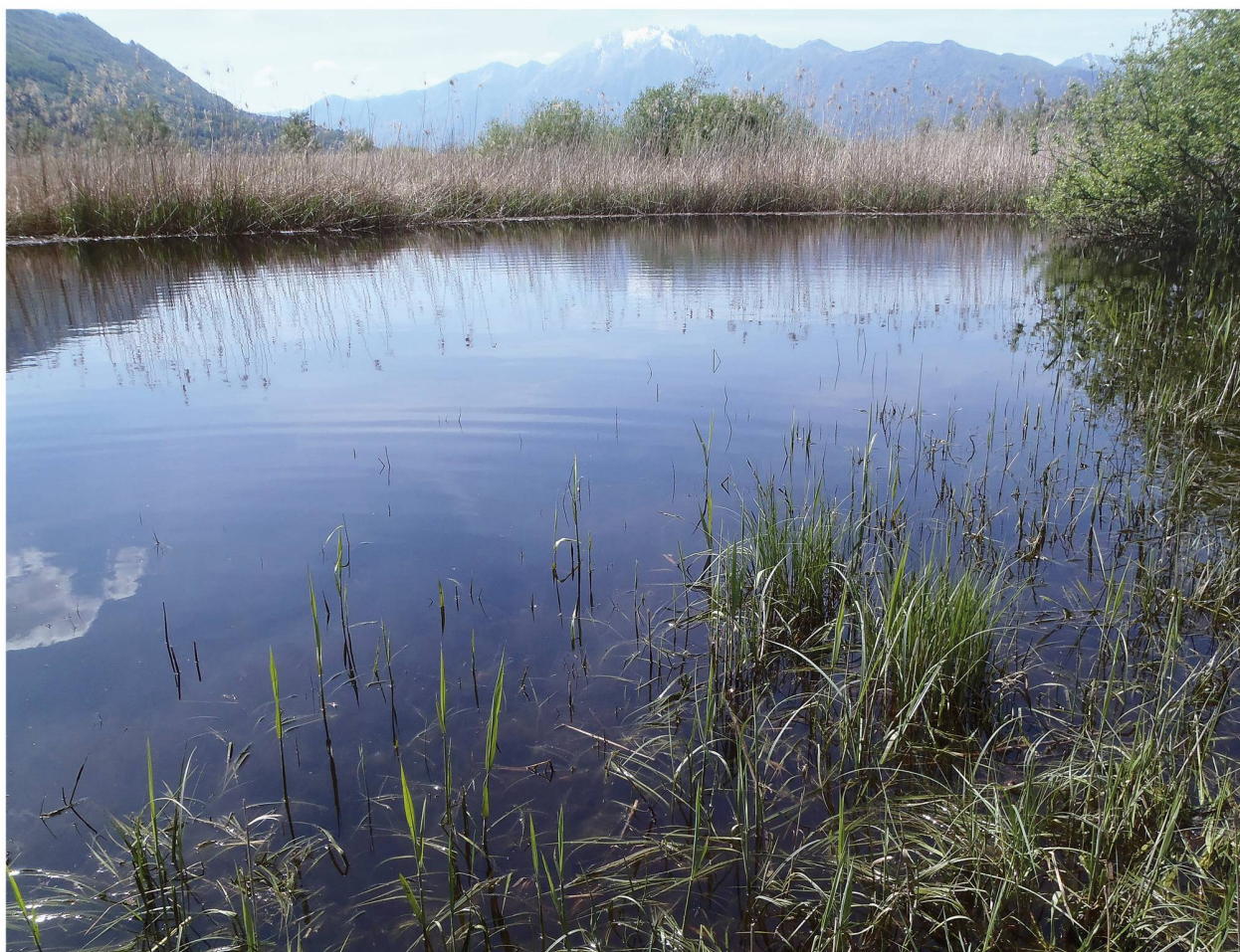
Figura 2: Bolle di Magadino, il sito di ritrovamento in Canton Ticino in cui convivono entrambe le specie.

citata poi dagli autori successivi: riassunti in Servadei 1967), precede di alcuni anni la descrizione di M. griseola (Horváth 1899; Jansson 1986) e potrebbe anche riferirsi (almeno in parte) a questa specie, oltretutto a possibili altre specie congeneriche. Comunque Tamanini (1948) riporta materiale di Vercelli (Piemonte), raccolto dallo stesso Mella nel 1866, che identifica come forme brachittere di Micronecta meridionalis (A. Costa, 1862), sinonimo di M. scholtzi , ed è quindi probabile che la citazione di Mella (1893) sia da ricondurre a quest'ultima specie.