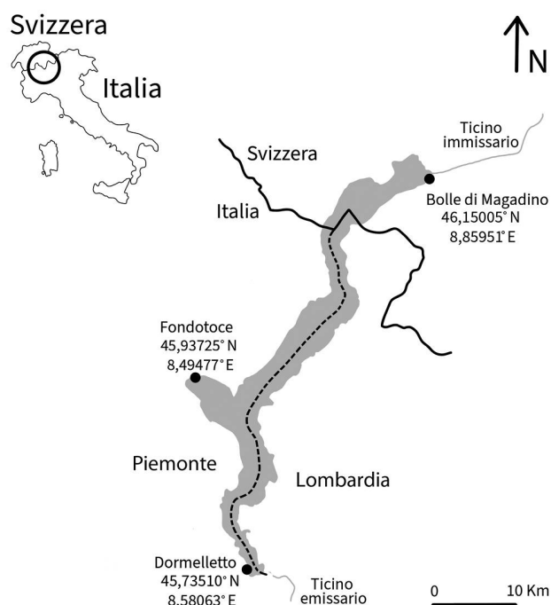
Figura 1: Siti di ritrovamento di Micronecta sul Lago Maggiore.

Il lago è incluso nel programma di monitoraggio della Commissione internazionale per la protezione delle acque italo-svizzere (CIPAIS, www.cipais.org ) e, grazie ad esso, è monitorato per gli aspetti biologici (fito- e zooplancton, pesci) e chimico-fisici sin dagli anni '80. Nell'ambito del progetto triennale (2019-2021) Ricerca e innovazione nel Lago Maggiore: indicatori di qualità nel