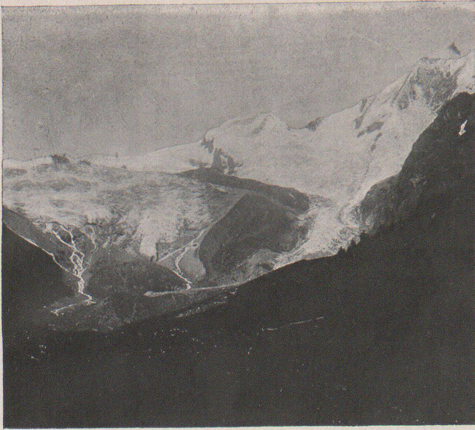
a) FRONT DU GLACIER DE SAAS FEE ○ ○ (VALAIS) ○ ○