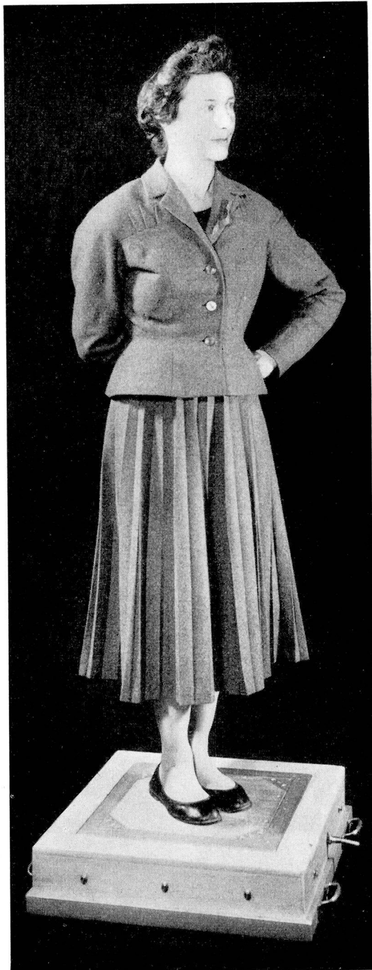
Abb. 1 Reaktionstisch in einer Ausführungsform für « stehende » Personen