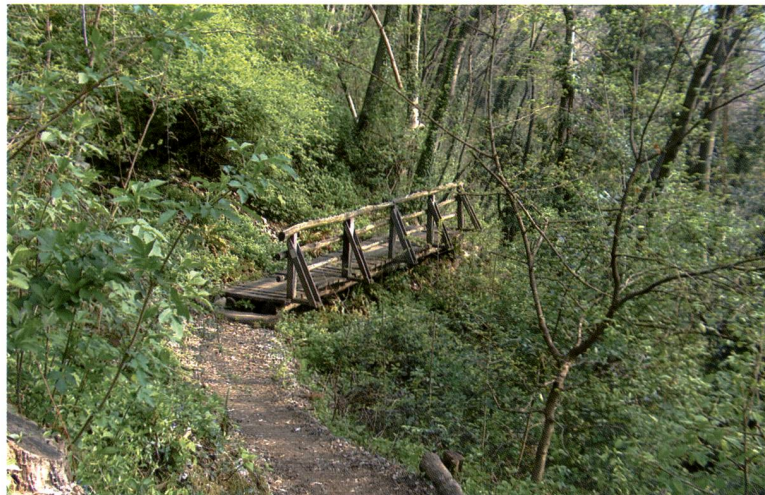
Fig. 3 – Un tratto dei 12 km di sentieri che permettono di visitare il Parco agevolmente.

cati, pur consentendo una dettagliata visione a distanza con stazionamento sui sentieri. La visita del Parco è consentita solo a piedi. Inoltre, la scelta appropriata del tracciato del sentiero didattico che facilita la protezione delle parti più sensibili, la sensibilizzazione dei visitatori mediante accompagnamento da parte di guide e alla sorveglianza regolare da parte del personale del Parco sono alla base della gestione corrente dell'intero territorio.