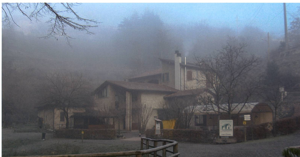
Fig. 4 – Il mulino del Ghitello, sede della direzione del Parco, centro di accoglienza dei visitatori, centro informazioni e documentazione.

Purtroppo il territorio del Parco ha subito nel tempo eventi che ne hanno alterato e danneggiato le caratteristiche. L'incuria dei boschi e delle aree un tempo coltivate, le cave aperte per la fabbricazione del cemento hanno portato al deterioramento degli elementi costitutivi del paesaggio e delle testimonianze stori-