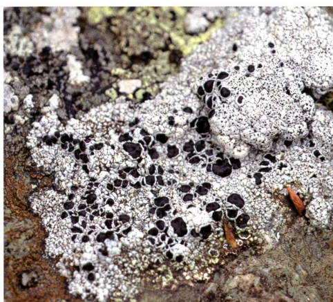
Fig. 5 – Tephromela atra (Huds.) Hafellner. I grandi apoteci a disco nero su tallo bianco-grigio possono essere d'aiuto per giungere alla diagnosi corretta. L'esame al microscopio è necessario.