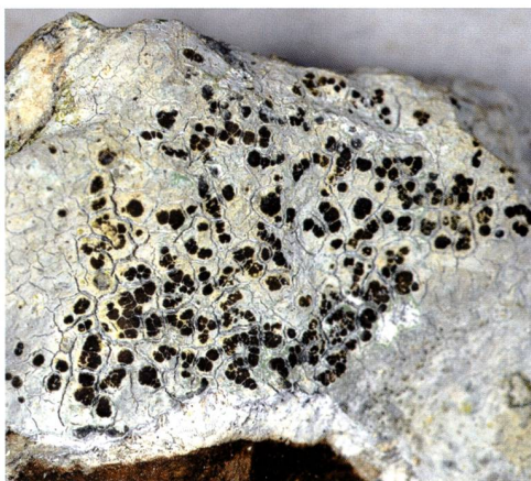
Fig. 3 – Bellemerea alpina (Sommerf.) Clauzade & Cl. Roux. Uno dei molti licheni epilittici dal colore bianco-grigiastro. Per la sua determinazione è indispensabile l'uso del microscopio.