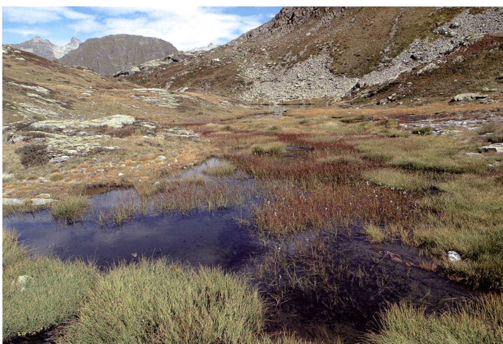
Fig. 2 – Le pozze di torbiera della zona di interrimento del laghetto di Mottone sono un importante sito di riproduzione per almeno tre specie di libellule, tra cui la rara Leucorrhinia dubia , che qui registra la seconda più alta stazione della Svizzera.