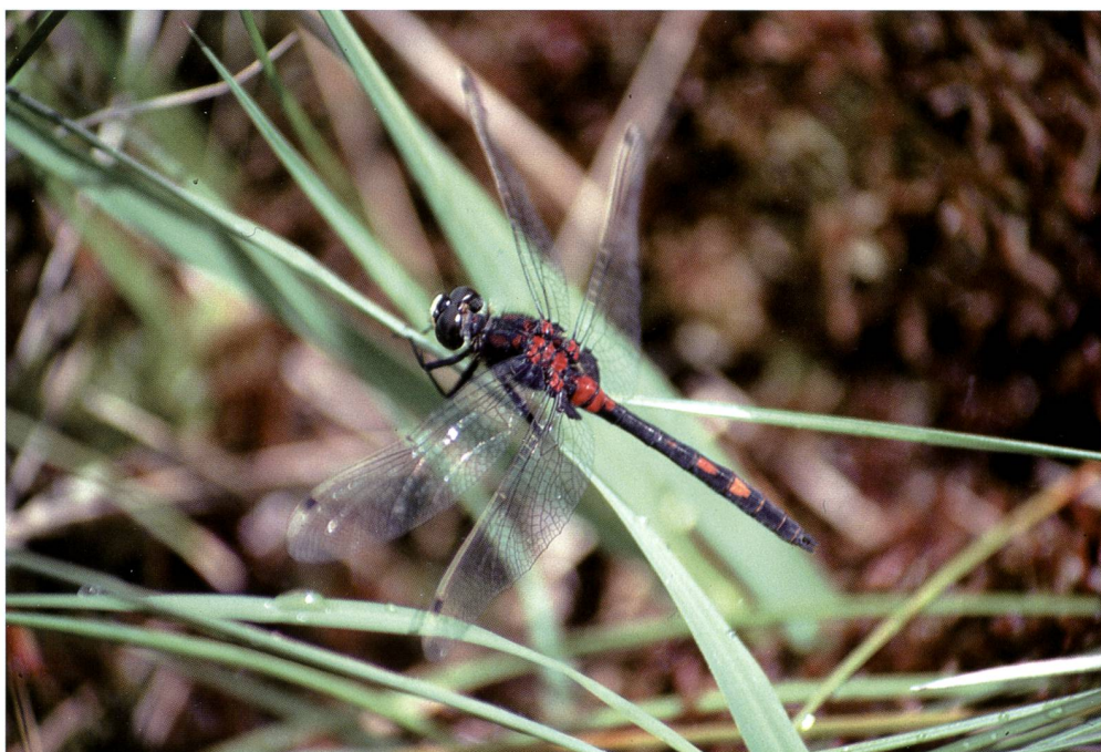
Fig. 3 – Leucorrhinia dubia è presente in Ticino soltanto in pochissime torbiere situate tra l'orizzonte montano e quello alpino.