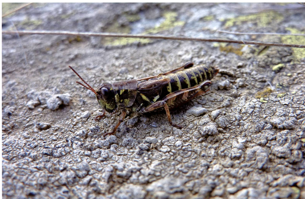
Fig. 3 – Bohemanella frigida è una tipica specie alpina che occupa soprattutto i prati di altitudine. Come altre specie delle alte quote ha ali atrofizzate.