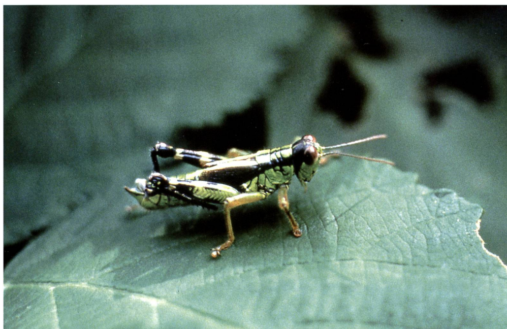
Fig. 4 – Miramella formosantata è stata trovata in Val Piora alla quota di 2000 m s.l.m., la più alta finora nota nel Cantone Ticino.