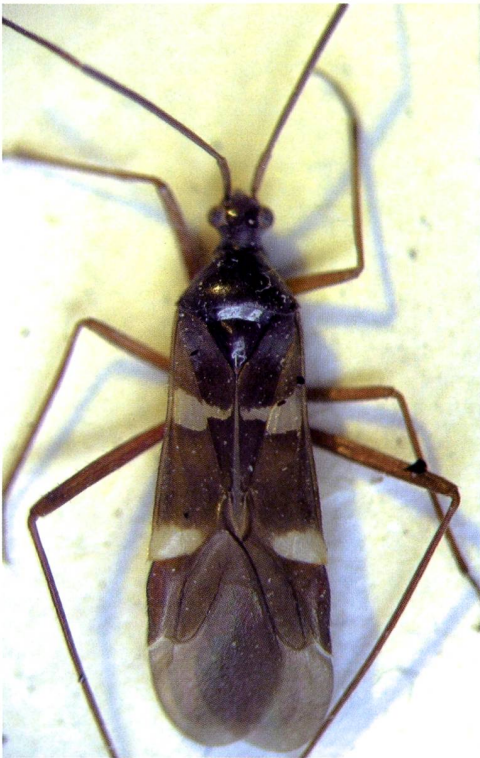
Fig. 2 – Systellonotus alpinus di Livigno (Foto P. Dioli).

Val D'Aosta sono infatti simili a S. weberi mentre quelli delle Prealpi venete (M. Baldo – Verona) presentano caratteri analoghi a S. insularis della Corsica. In generale, gli esemplari meridionali hanno una colorazione rossiccia e il terzo articolo antennale lungo 0,8 volte il secondo. Nella serie tipica di S. alpinus , i due articoli antennali sono invece identici.