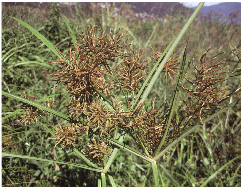
Fig. 3 – Caratteristiche spighe composte dello zigolo dolce ( Cyperus esculentus ) a Riazzino.

Lo zigolo dolce cresce in zone con sufficienti piogge estive o in campi irrigati. Colonizza