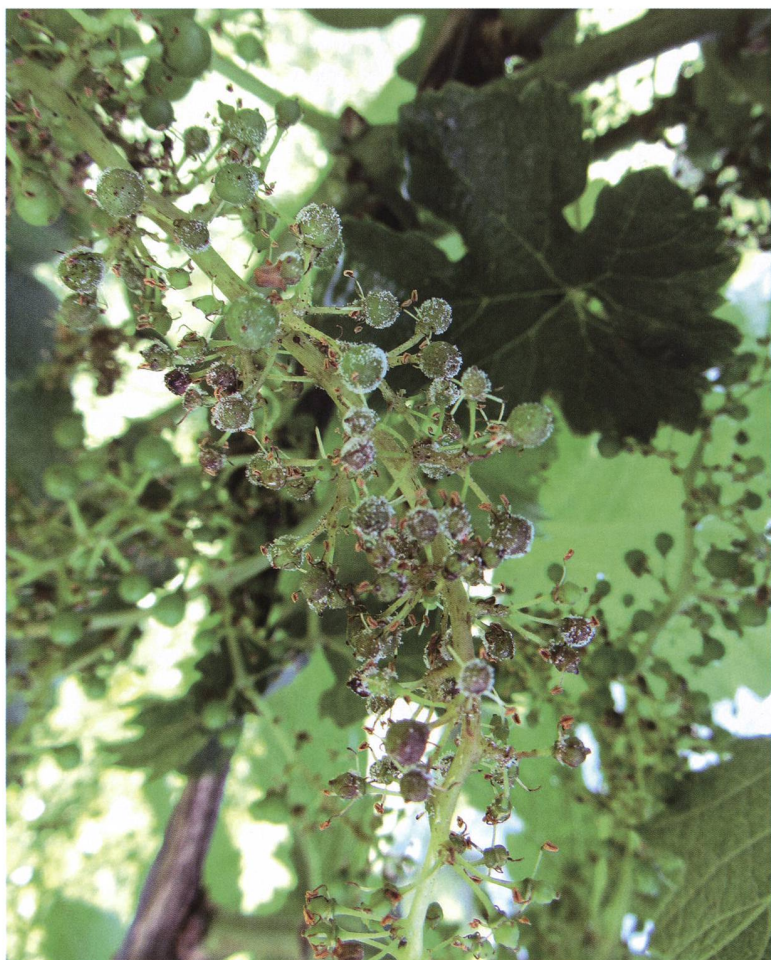
Fig. 7 – Giovani acini con sporulazioni di peronospora ( Plasmopara viticola ).

L'oomicete Plasmopara viticola , appartenente alla famiglia delle Peronosporaceae e agente eziologico della peronospora della vite (Fig. 7), è classificato nel regno dei Chromista, poiché si differenzia dai funghi per molti aspetti, tra i quali la parete cellulare composta da cellulosa e non da chitina, i nuclei diploidi e non aploidi o dicariotici e per la presenza di zoospore biflagellate (Galet, 1999). Anche questo neomicete trova le sue origine nel continente Nord Americano dove Rouxel et al. (2013), hanno identificato quattro specie criptiche as-