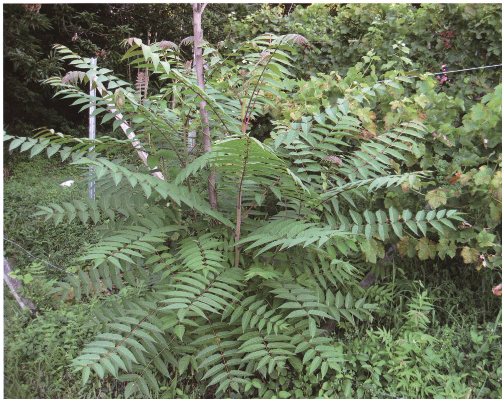
Fig. 1 – Giovane alberello di ailanto ( Ailanthus altissima ) nella scarpata di un vigneto terrazzato in Malcantone.