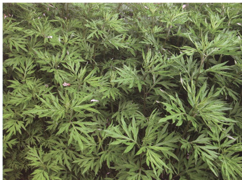
Fig. 2 – L'artemisia de fratelli Verlot ( Artemisia verlotiorum ) forma dei popolamenti monospecifici densi.

La modalità d'introduzione dell'assenzio dei fratelli Verlot (Fig. 2) in Europa non è conosciuta. Si ipotizza che la specie di origine asiatica sia arrivata accidentalmente come malerba, assieme ad altre piante importate