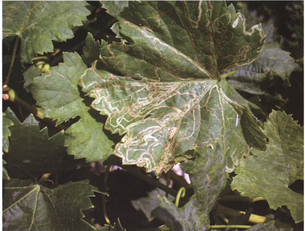
Fig. 9 – Danno fogliare causato dalle larve della minatrice americana della vite Phyllocnistis vitigenella (foto: Mauro Jermini).

sono specifiche e pertanto la loro azione di controllo biologico dipende dalla gestione del vigneto e degli elementi del paesaggio circostante che favoriscono il mantenimento delle popolazioni. Al momento attuale la minatrice americana non costituisce un problema fitosanitario rilevante e pertanto non si sono sviluppate strategie di lotta diretta.