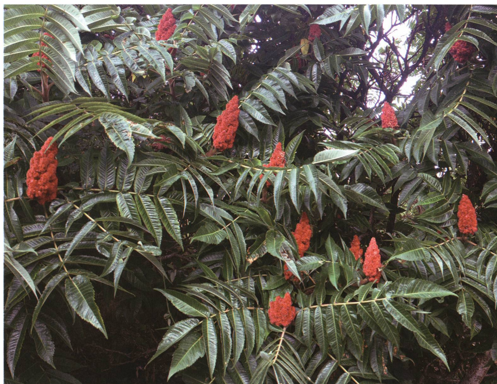
Fig. 5 – Infiorescenze a pannocchia compatta del sommacco maggiore ( Rhus typhina ), a Brusino.

Il sommacco maggiore, (Fig. 5), pianta di origine nord americana, fu introdotto per scopi ornamentali a Parigi già nel 1620 per il suo fo-