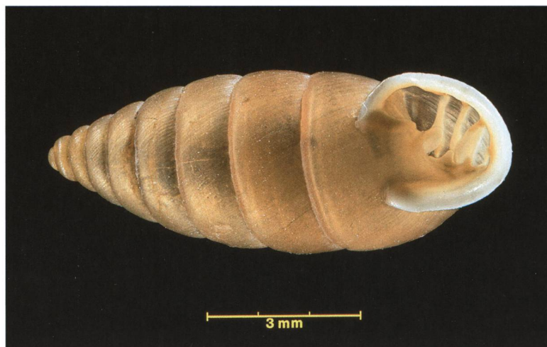
Fig. 2 – Granaria illyrica.

La fauna aracnologica del Cantone Ticino è da considerarsi come ben conosciuta. Già Pavesi nel 1873 stilò un catalogo comprensivo di 206 specie. In seguito, nel 1918 e 1929, Schenkel pubblicò i risultati delle sue vaste catture eseguite sul territorio ticinese. Nel catalogo dei ragni della Svizzera di Maurer & Hänggi (1990) vengono segnalate più di 500 specie di ragni per il Ticino. In tempi relativamente più recenti sono state eseguite diverse ricerche con raccolta di invertebrati che hanno pure contemplato estese raccolte di ragni ma i cui risultati sono stati purtroppo solo in parte pubblicati (Pronini, 1989, Moretti et al. , 2002). Nel 1992 Ambros Hänggi ha eseguito campionamenti in più di 30 stazioni di prati e pascoli magri (Hänggi, 1992). Pur avendo i vigneti una struttura ambientale simile, grazie alle raccolte effettuate nell'ambito della ricerca BioDiVine e della sua fase pilota, sono state censite più