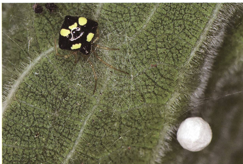
Fig. 3 – Icius hamatus (foto: © Michael Schäfer).