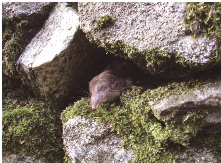
Fig. 1 – Crocidura leucodon Crocidura ventre bianco.

Gli esperti contattati sono dei professionisti attivi a livello svizzero che hanno partecipato all'elaborazione di Liste Rosse o a programmi nazionali di monitoraggio; per questa ragione essi hanno una buona conoscenza del gruppo faunistico di competenza nonché una visione globale dell'ecologica e dello stato di conservazione della fauna presente in Svizzera.