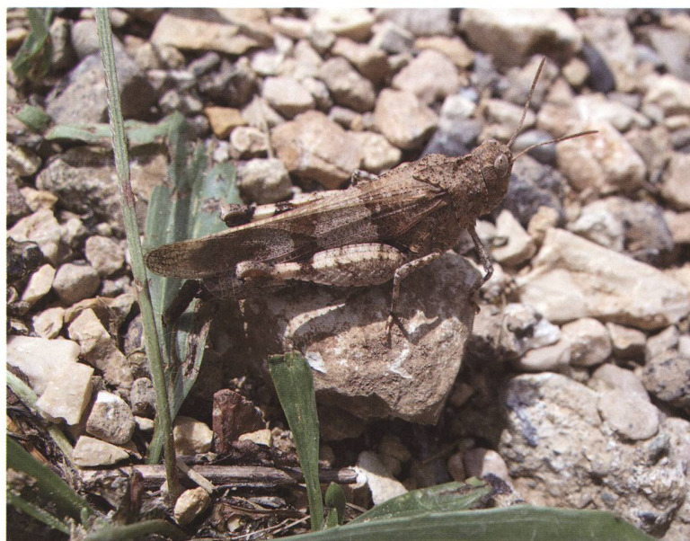
Fig. 6 – Xylocopa violacea.