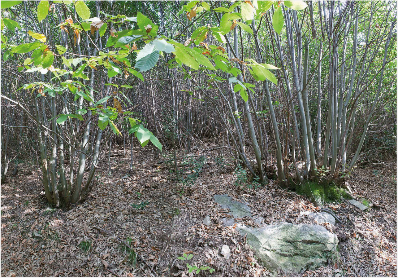
Fig. 2 – Castagneto gestito a ceduo.

acclivi e di scarso pregio agricolo, ma adatti alla coltivazione del castagno) hanno spinto le popolazioni locali a specializzarsi nella castanicoltura da frutto e a fare della castagna una delle principali fonti di sostentamento. Una cultura millenaria che ha caratterizzato non solo le tradizioni e i ritmi di vita della popolazione, ma anche il paesaggio delle vallate sudalpine.