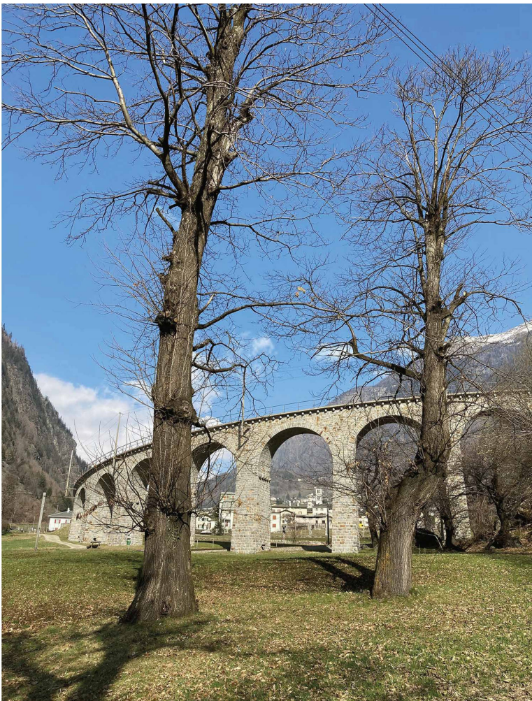
Fig. 1 – Castagni potati inizio anni Novanta nei pressi del Viadotto di Brusio.

italiano) con l'obiettivo di salvare e recuperare alla produzione i vecchi castagni da frutto con le chiome compromesse dall'attacco del cancro corticale. Sull'esempio della Bregaglia e sempre promosso dalla Pgi, pochi anni dopo l'Ufficio foreste e pericoli naturali dei Grigioni, ha allestito un primo progetto anche a Brusio, in Val Poschiavo (Fig. 1).