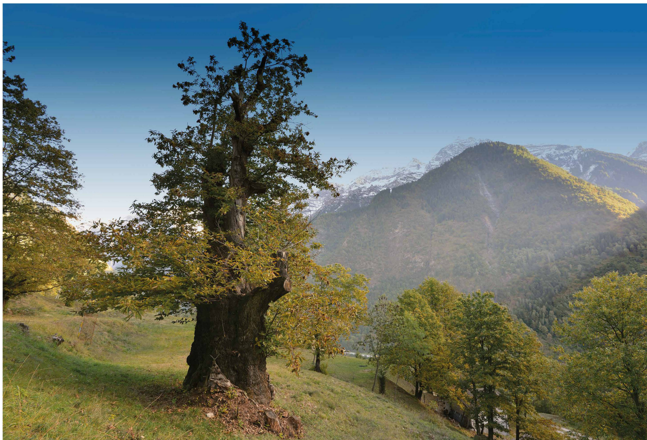
Fig. 5 – Castagno monumentale nella selva castanile Nosall nel Comune di Soazza.

quelle caratterizzate da un tronco centrale predominante, mentre altre varietà come la Luina o Livina hanno chiome contorte. Altre come la Verdanesa si dividono in più branche principali (Conedera et al. 2021, in questo volume). Nelle selve rinnovate dall'inizio del Novecento si trovano anche i marroni. Particolari sono anche i capitozzi, presenti soprattutto a San Vittore e Roveredo. Si tratta di castagni di grosse dimensioni ma regolarmente tagliati a 2-3 metri d'altezza. La chioma dei capitozzi forma dei polloni utilizzati quali paleria nelle vigne del posto.