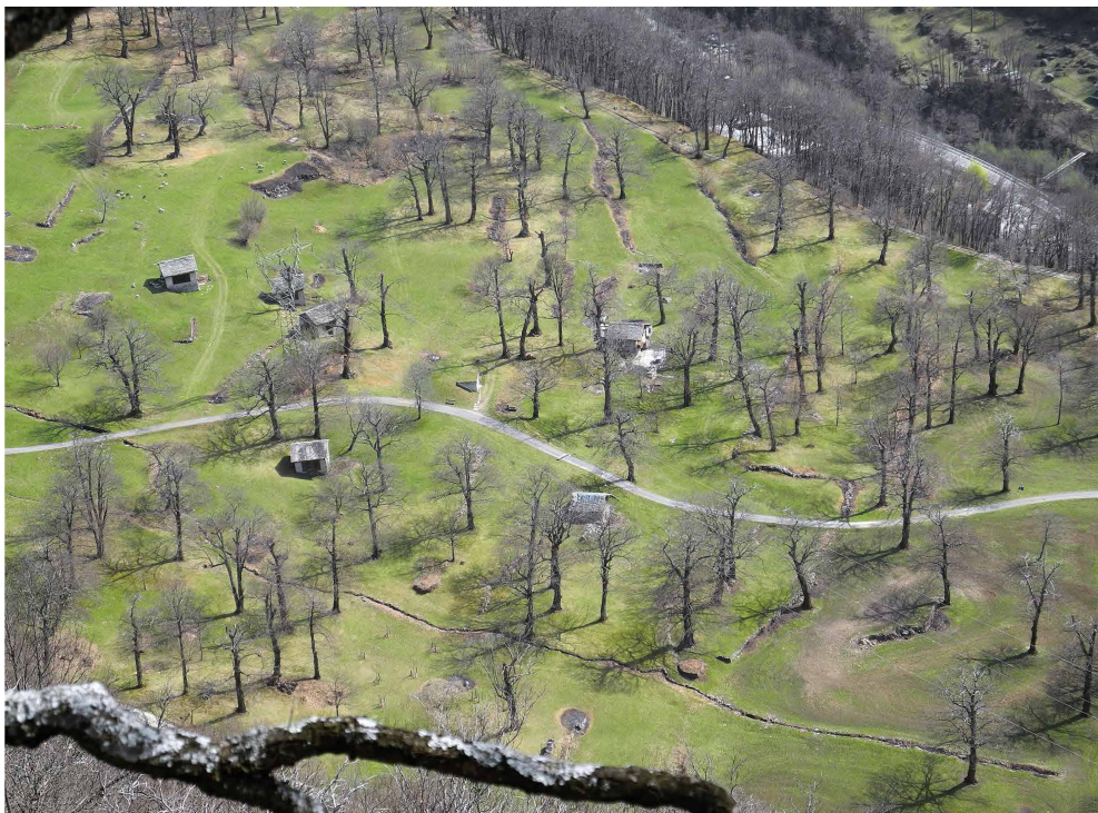
Fig. 2 – Selva castanile Brentan, Comune di Bregaglia.

Da un punto di vista fitosanitario, il problema maggiore è attualmente rappresentato dalla diffusione del mal d'inchiostro ( Phytophthora spp. ) che ha già colpito letalmente ca. 30 castagni maestosi. La fersa del castagno ( Mycosphaerella maculiformis ) e il cinipide galligeno ( Dryocosmus kuriphilus ) hanno un influsso negativo sulla produzione di castagne. Negli ultimi 10 anni anche il cancro corticale del castagno ( Cryphonectria parasitica ) ha ripreso forza, danneggiando le chiome e facendo seccare le giovani piantine. La rinnovazione delle selve è molto importante e quindi, per migliorare questo aspetto, dal 2016 in Bregaglia l'azienda forestale locale ha allestito un piccolo