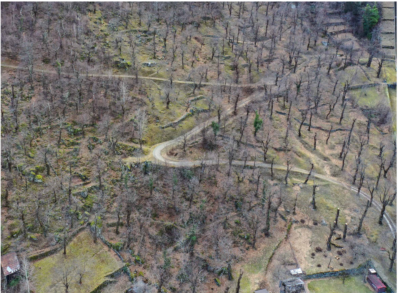
Fig. 3 – Selva a Campocologno, Comune di Brusio.

Le selve castanili e la castanicoltura in Bregaglia sono valorizzate in modo esemplare anche a livello turistico. Ne è testimone il notevole successo delle due settimane del Festival della castagna che si svolgono nel mese di ottobre, quando la valle si riempie di turisti. Dal 2001 si può percorrere un sentiero tematico sul castagno nella selva del Brentan. Nel 2020 è stato attribuito un grande riconoscimento alla castanicoltura della Bregaglia: la castagna essiccata bregagliotta è stata accolta nell'Arca del Gusto Slow Food.