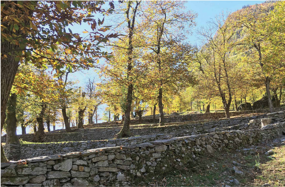
Fig. 4 – Selva terrazzata con muri a secco nella Collina di Lostalio.

Attualmente il problema maggiore è rappresentato dallo stato fitosanitario dei castagni colpiti in modo forte dal recrudescente cancro corticale che attacca le chiome dei grossi castagni e fa seccare quelli giovani.