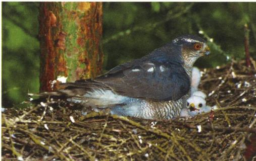
Sperber-Männchen mit Jungen

Oft beginnen die Männchen bei den Greifvögeln mit dem Bau des Nestes. Wenn sie verschiedene Nester anlegen, wählt das Weibchen den besten Horst aus und beteiligt sich am Ausbau. Der Nestrand wird in der Regel mit einem Kranz aus Zweigen gefertigt und das Innere mit feinerem Pflanzenmaterial ausgepolstert. Rohrweihen kleiden ihr Nest mit Schilfhalm aus, Milane verwenden dazu unter anderem auch Abfälle. Wespenbussarde und Habichte erneuern ihre Horste während der Brut laufend mit frischem Grün.