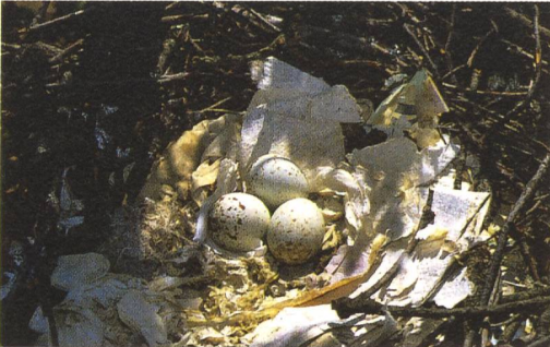
Schwarzmilanhorst mit Abfällen

Oft beginnen die Männchen bei den Greifvögeln mit dem Bau des Nestes. Wenn sie verschiedene Nester anlegen, wählt das Weibchen den besten Horst aus und beteiligt sich am Ausbau. Der Nestrand wird in der Regel mit einem Kranz aus Zweigen gefertigt und das Innere mit feinerem Pflanzenmaterial ausgepolstert. Rohrweihen kleiden ihr Nest mit Schilfhalm aus, Milane verwenden dazu unter anderem auch Abfälle. Wespenbussarde und Habichte erneuern ihre Horste während der Brut laufend mit frischem Grün.