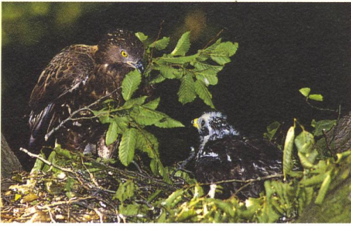
Begrünter Horst eines Wespenbussards