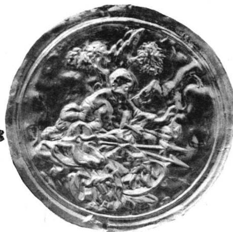
Medaillen des Klosters Wettingen.