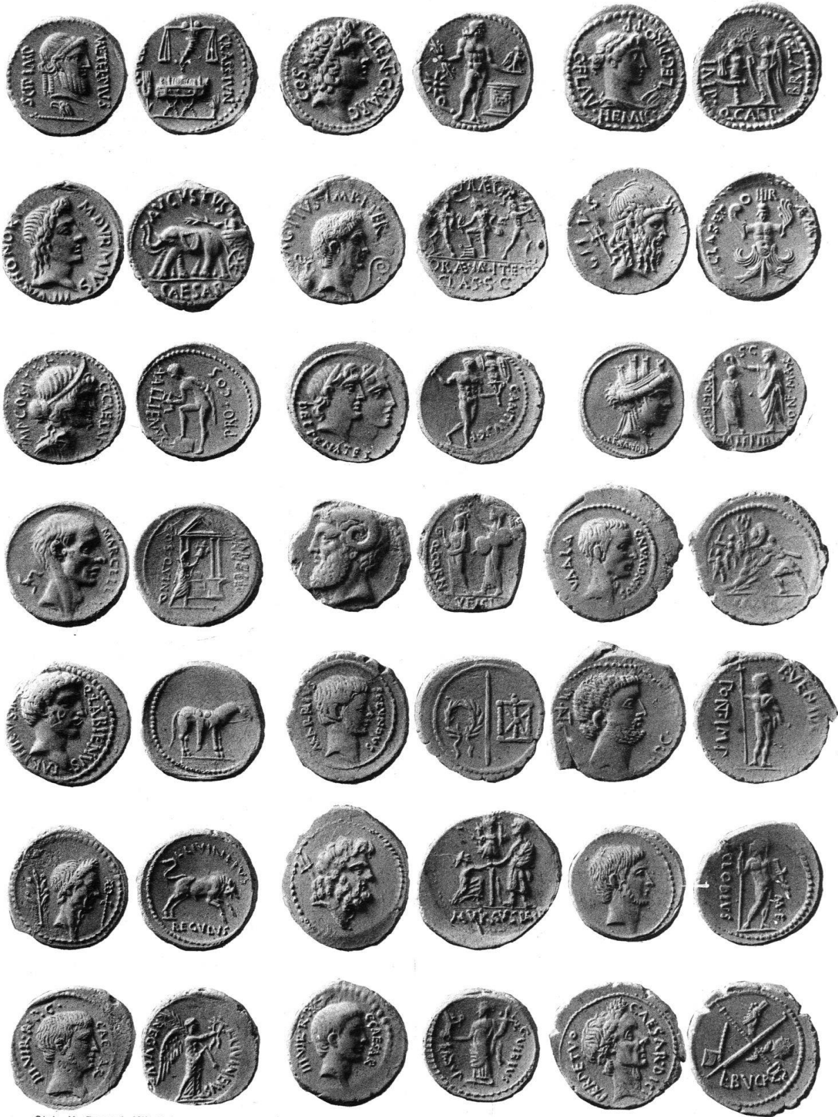
Stab. M. Bassani, Milano