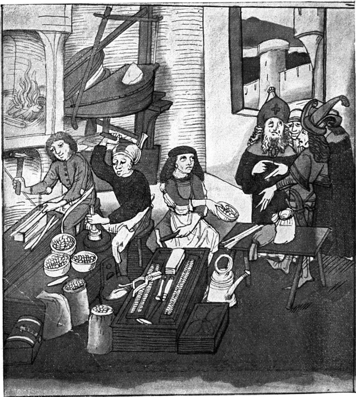
UN ATELIER MONÉTAIRE SUISSE