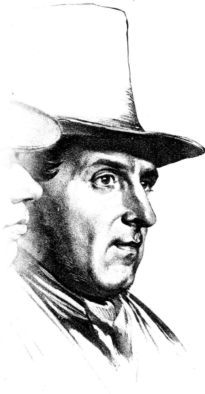
AUGUSTE BOVET, GRAVEUR GENEVOIS