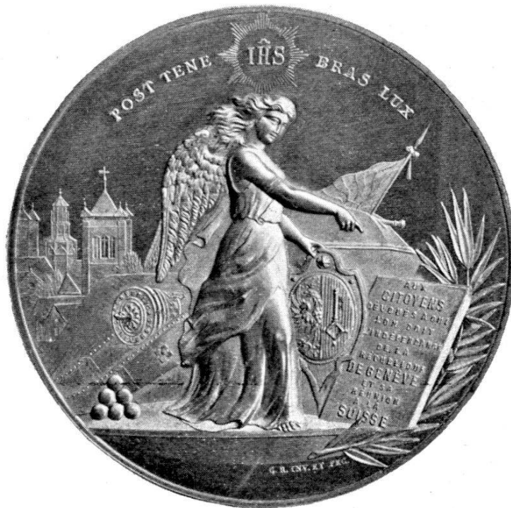
MÉDAILLE DE CH. PICTET DE ROCHEMONT, DE GENÈVE