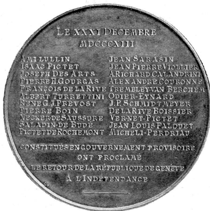
MÉDAILLE D'AMI LULLIN, DE GENÈVE