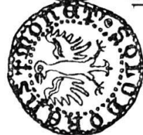
Monnaies suisses de la trouvaille de Wattenweiler.