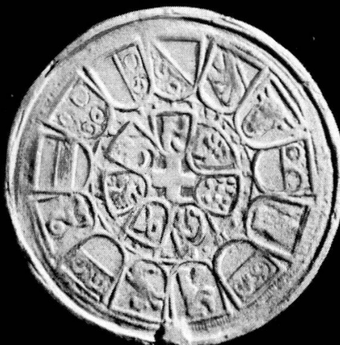
Medaillen zur Erinnerung an die Bündnisse der Eidgenössischen Orte mit Frankreich