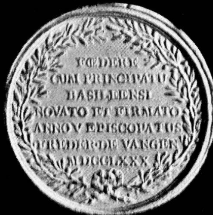
Medaillen zur Erinnerung an die Bündnisse der Eidgenössischen Orte mit Frankreich