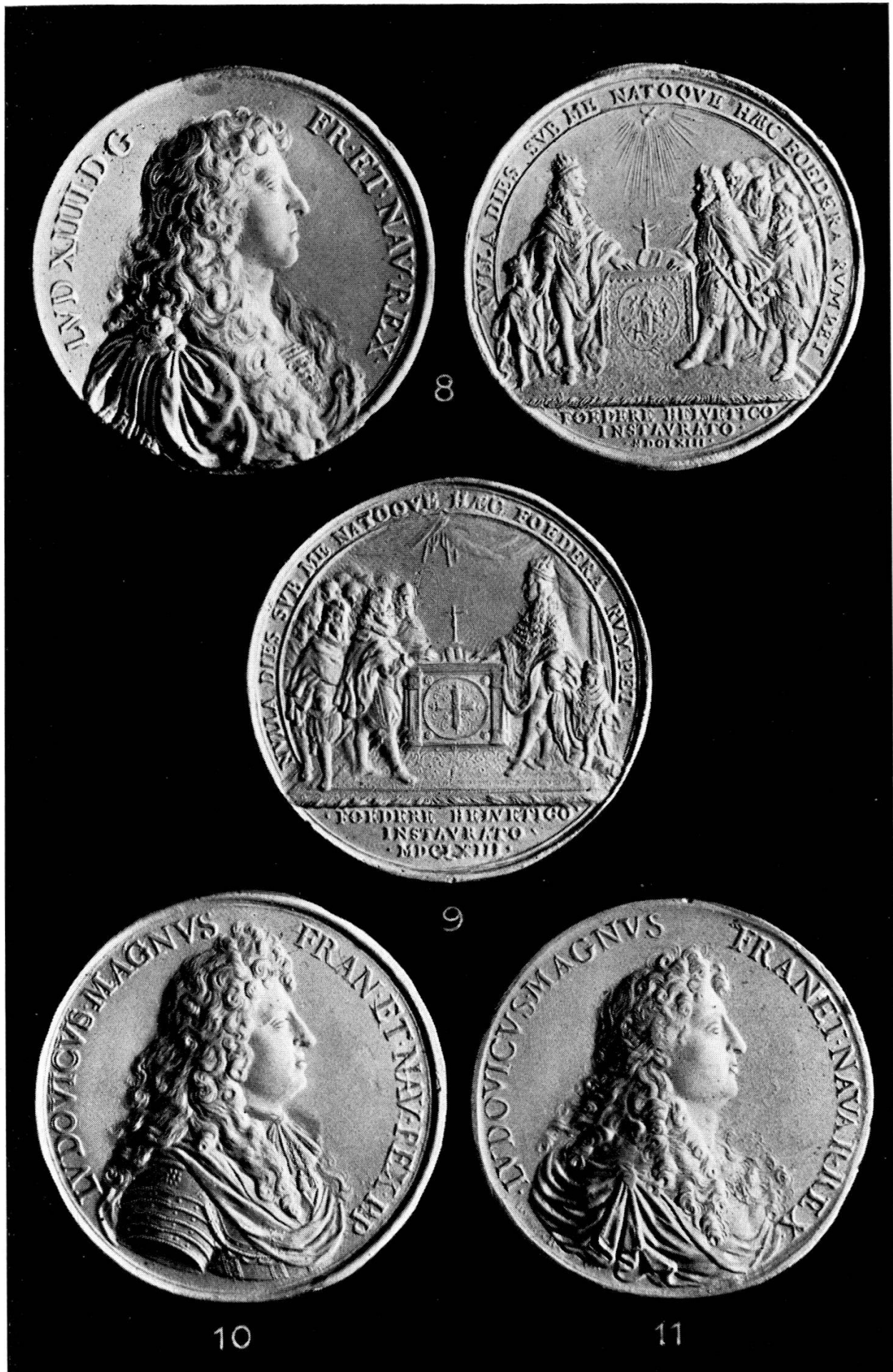
Medaillen zur Erinnerung an die Bündnisse der Eidgenössischen Orte mit Frankreich