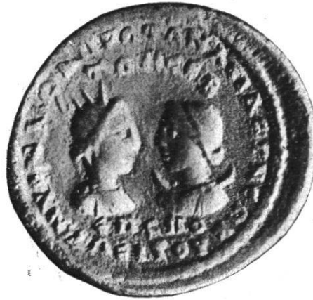
Abb. 8. Severus Alexander und Orbiana (Grossbronze).

(359—336 v. Chr.), T. II, 6 und Alexanders des Grossen (336—322 v. Chr.), dann auf einem athenischen Tetradrachmon um 200 v. Chr. (T. II, 7), ferner auf einem Tetradrachmon des oben S. 249 genannten Syrerkönigs Antiochos IV. und auf der bereits S. 250 erwähnten Billonmünze der römischen Provinz Syria (T. II, 8); sodann auf Cistophoren (2. Jahrhundert v. Chr.) z. B. auf einem von Ephesos (meine Sammlung), und auf einem der wiederholt genannten Stadt Tralleis, woselbst neben dem des Zeus der Kult des Apollon, des Helios und der Selene eine grosse Rolle spielte, was sich auf den Münzen der Stadt abspiegelt.