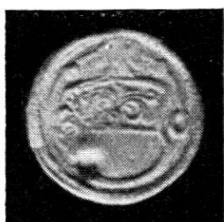
Wahlpfennig o. J. Kupfer