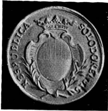
Wahlpfennig 1774 Silber