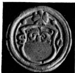
Wahlpfennig o. J. Zinn