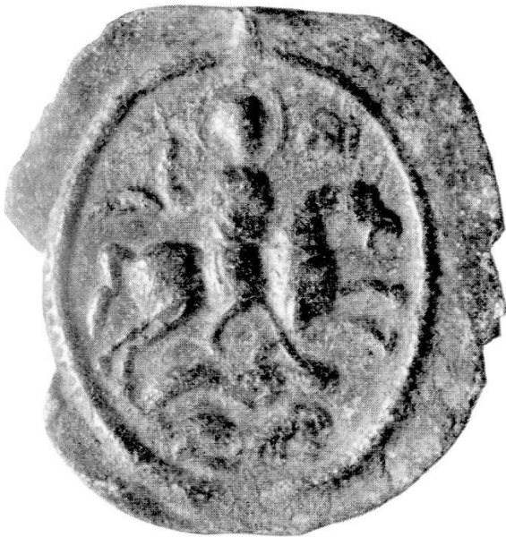
Abb. 5. Berlin, Kaiser Friedrich-Museum.