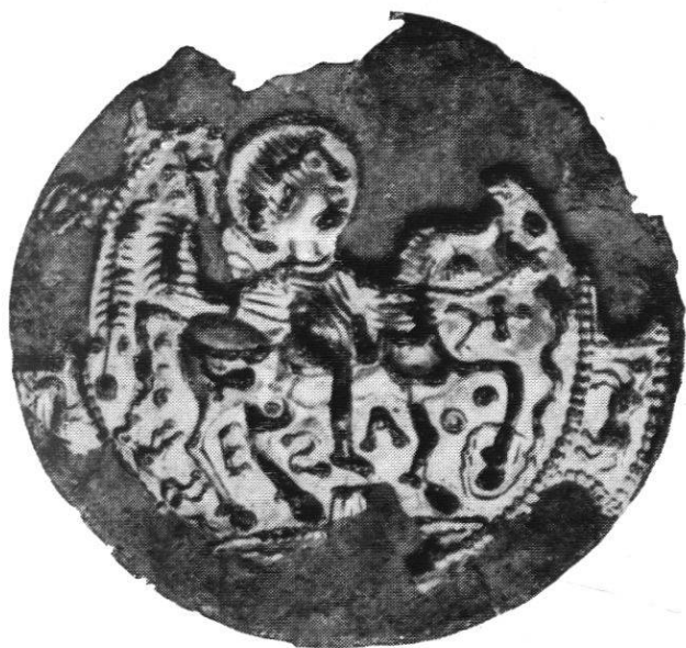
Abb. 1. Aus La Copelenaz. Zürich, Schweizerisches Landesmuseum.