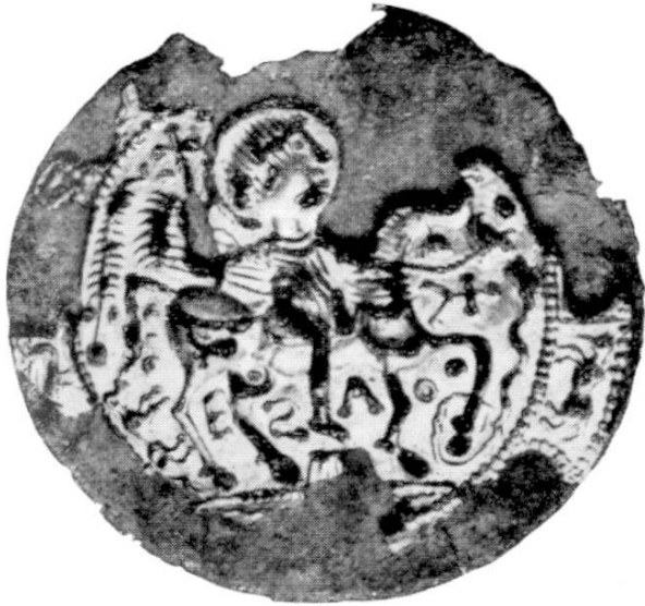
Abb. 1. Aus La Copelenaz. Zürich, Schweizerisches Landesmuseum.