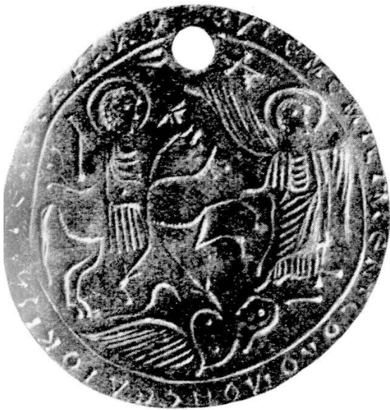
Abb. 3. Aus Kyzikos. Paris, Louvre.