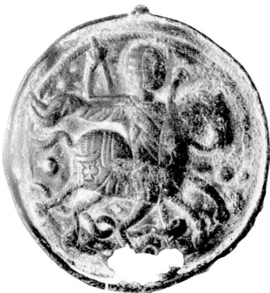
Abb. 8. Berlin, Kaiser Friedrich-Museum.