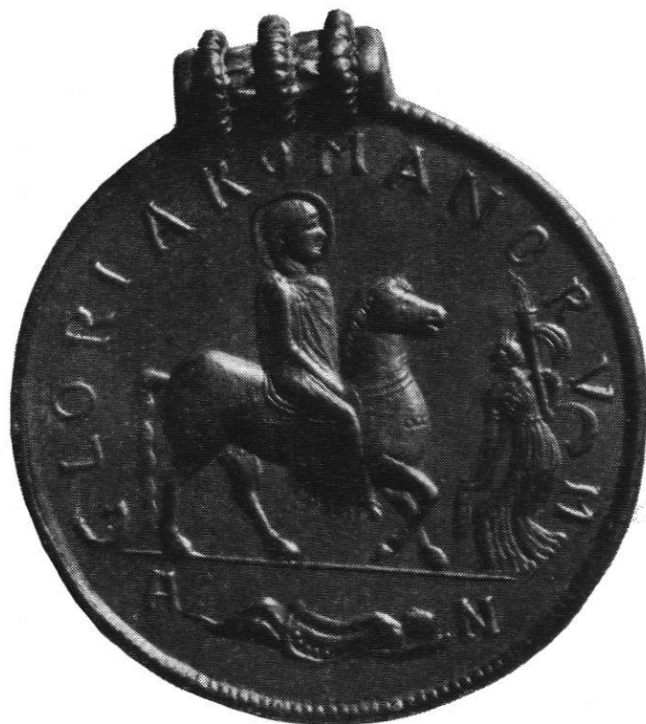
Abb. 2. Valens. Aus Szilágy Somlyó. Wien, Münzkabinett.