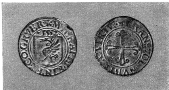
Frappe en étain (Musée National)