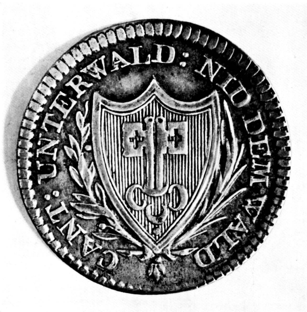
Die Nidwaldner Münzen von 1811