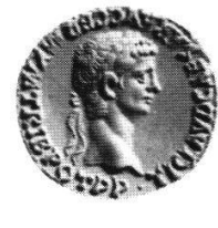
12 AR (F)