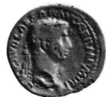
4 AR plat.