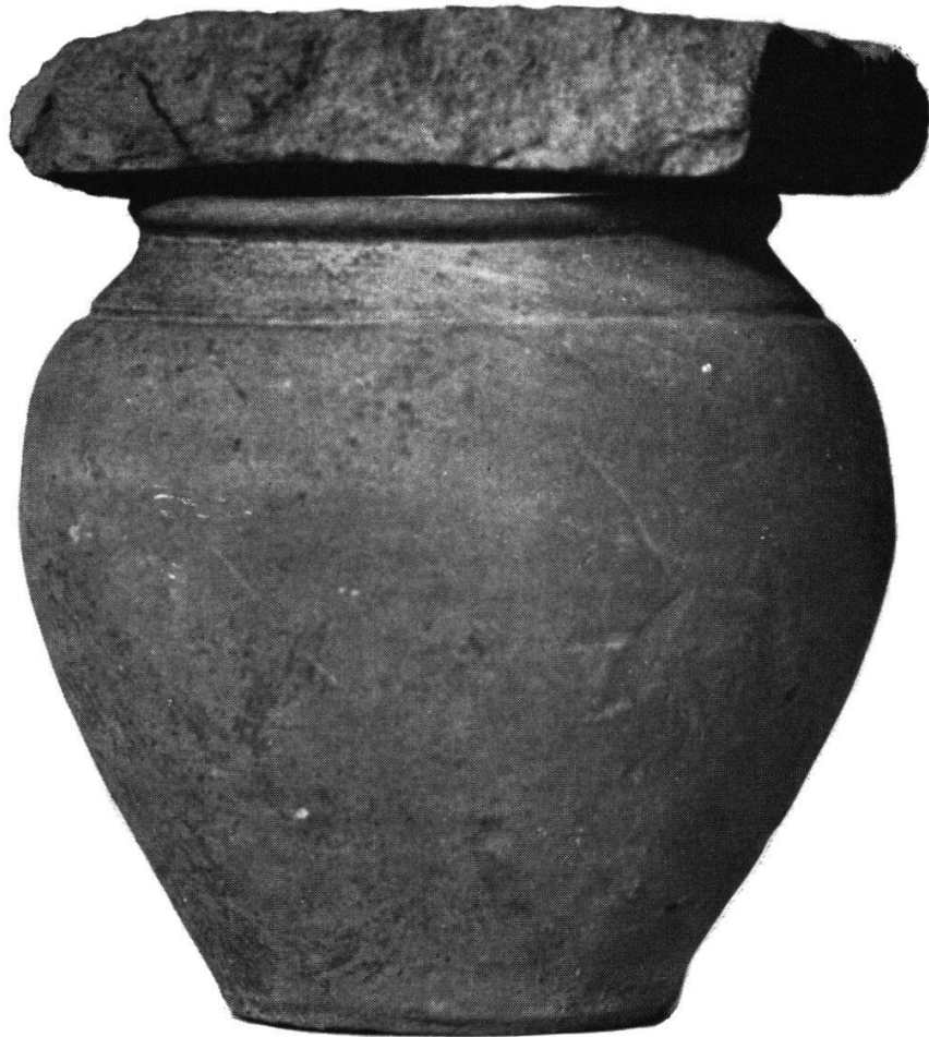
2 et 3 Echelle \frac{1}{2} Le récipient