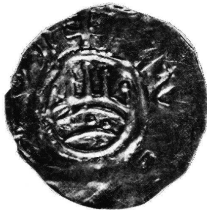
1065: Zweifache Vergrößerung

Von den drei Exemplaren im Funde läßt uns nunmehr eines, die Nr. 1065, eine bisher nicht abgeklärte Frage endgültig bereinigen: mit den deutlich lesbaren Buchstaben TV und E, wie die untenstehende Vergrößerung zeigt, muß «TVRECVM» ergänzt werden, d. h. dieser Typus ist wirklich in Zürich geschlagen.