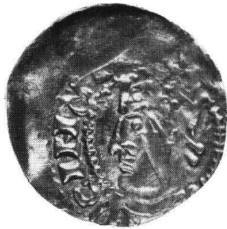
Nr. 895 Straßburg, Konrad II.