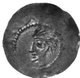
Deventer Heinrich II., Nr. 180

Weit über die Hälfte seines Bestandes entfällt auf den sehr primitiven mittelhheinischen sogenannten Holzkirchentypus. Die Münzstätten, die ganz besonders bei der Kaiserkopfdarstellung eine maßgebende künstlerische Rolle spielen, wie Regensburg und Augsburg, fehlen. Die schönen Köpfe im Rheinland (Duisburg, Dortmund usw.) beginnen erst mit der Spätzeit von Konrad II. und erreichen unter den Nachfolgern Heinrich III. und IV. ihren Höhepunkt. Zwei prächtige Realisationen dieser Typen, Trier Nr. 152 (wohl in Koblenz geschlagen) und Duisburg Nr. 223 befinden sich wohl unter unseren Beständen, indes ist das erstere Stück durch eine Prägeschwäche im unteren Teil der Münze sehr beeinträchtigt, beim zweiten überrascht für die späte Prägezeit ein sehr trauriger Erhaltungszustand, der kaum den Münzort, geschweige denn den Kopf erkennen läßt. Wenn auch die Köpfe von Tiel und Friesland, Eßlingen und Straßburg nicht den hohen künstlerischen Rang wie die oben erwähnten haben, so entbehren diese Münzen keineswegs eines gewissen Reizes, der unserer Ansicht nach gerade in der Sichtbarmachung der überpersönlichen Königsdarstellung liegt. Das soll nun durch ein paar Beispiele in anderthalbfacher Vergrößerung gezeigt werden.