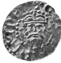
Friesland Konrad II., Nr. 194