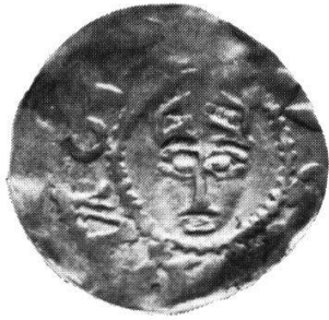
Tiel Konrad II., Nr. 170