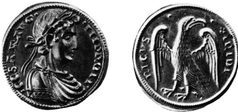
Abb. 1 Goldaustalis Kaiser Friedrichs II. Eine der frühen Emissionen. Stempel E 35 / B 4. Katalog-Nr. 149. Zweifach vergrößert.

Die seit dem Jahre 1231 in Messina und Brindisi geprägten Augustalen Friedrichs II. von Hohenstaufen zählen aufgrund ihrer künstlerischen und technischen Vollendung sowie des völlig unzeitgemäßen, antikisierenden Kaiserbildnisses zu den berühmtesten Schöpfungen der 2600jährigen Geschichte der Goldprägungen (Abb. 1).