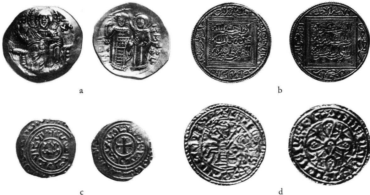
Abb. 2 Goldmünzen des Mittelmeerraumes aus der ersten Hälfte des 13. Jahrhunderts

Unteritalien und Sizilien, lange Zeit unter byzantinischer und arabischer Herrschaft, wurden im Laufe des 11. Jahrhunderts von den Normannen erobert und 1130 unter Roger II., dem Großvater Friedrichs II., zum Königreich Sizilien vereinigt. Wie auf vielen anderen Gebieten hielten die toleranten Normannen auch bei der Münzprägung an den Traditionen ihrer Vorgänger fest. Ihre Münzen tragen, häufig