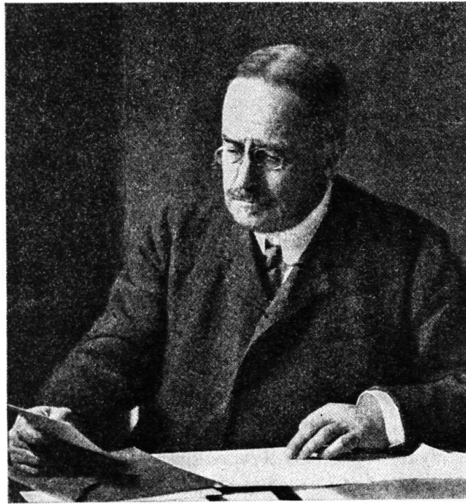
Eugène Demole, Präsident 1908–1924.

spezialisierte sich auf die Farbbildherstellung 1 . Zum «Fin lettré» erzog er sich selbst. Kurz nach 1880 trat er in das noch sehr kleine «Cabinet de numismatique» ein, dem er ab 1882 fast dreißig Jahre lang als Konservator vorstand. Es war sein Verdienst, daß der Bestand an Genfer Münzen für die Epoche von 1535 bis 1848 um 5600 Stück erweitert werden konnte. Im Jahre 1887 erschien sein Hauptwerk, «Histoire monétaire de Genève». Zusammen mit seinem Freund, dem Neuenburger Konservator William Wawre bearbei-