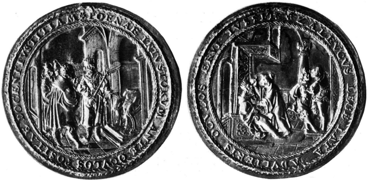
Abb. 4 Gerechtigkeitsmedaille Kambyses und Sisamnes – Zaleukos von Lokri.

gewiesen 11 . Die Vorderseite zeigt, wie der König Kambyses den neuen Richter Otanes installiert: Auf dem Richterstuhl sitzt die kopflose, ausgestopfte Haut des Sisamnes, der wegen Bestechlichkeit lebendigen Leibes geschunden wurde und dessen Amt der Sohn antritt. Auf der Rückseite demonstriert Zaleukos, der strenge, aber gerechte Gesetzgeber von Lokri, auf nicht minder brutale Art den unbedingten Gehorsam gegenüber seinem Gesetz und sein väterliches Mitleid zugleich. Auf Ehebruch bestimmte er Blendung als Strafe und blieb auch dann dabei, als sein eigener Sohn dieses Vergehens überführt wurde. Als das Volk um Gnade bat, ließ er schließlich sowohl dem Sohne als auch sich selbst je ein Auge ausstechen. Zu dieser Medaille gibt es eine Variante mit Kambyses-Vorderseite und Schrift-Rückseite 12 , sowie eine einseitige, unten rechteckige, oben halbkreisförmige Plakette 13 . Da eine gleiche Plakette auch mit Skiluros existiert 14 , wäre wohl auch mit einer, allerdings bisher noch nicht entdeckten Kambyses/Skiluros-Medaille zu rechnen.