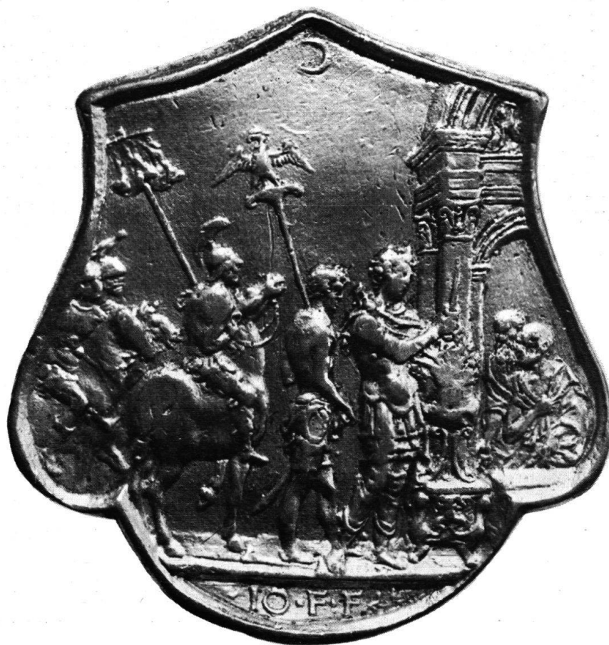
Abb. 5 Mucius Scaevola, Plakette. Vergrößert.