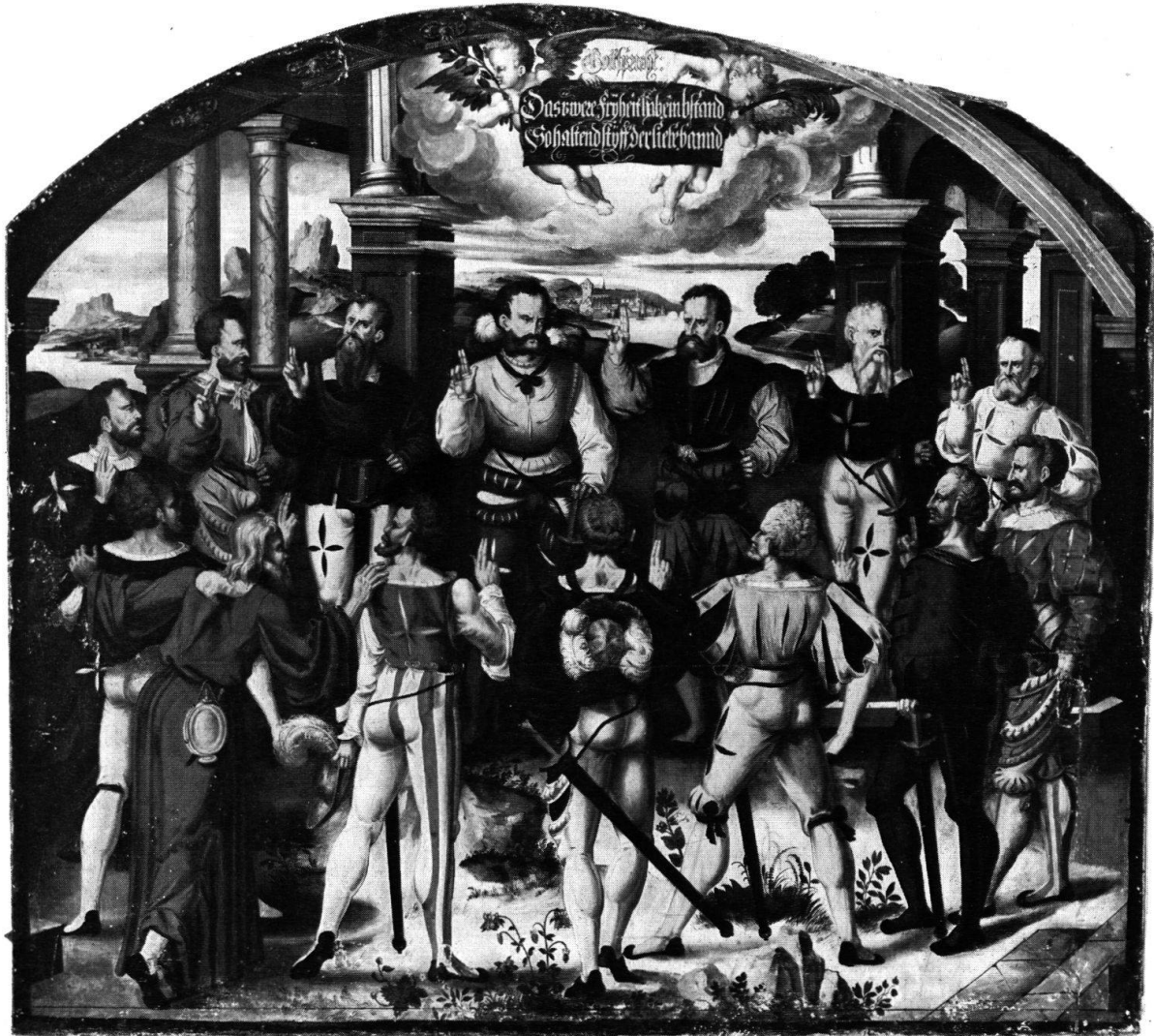
Abb. 3 Bundesschwur zu Stans 1481, von H. Mareschet, 1584–1586. Aus dem Berner Rathaus.

der einen Längswand stellte er die Gründungssage Berns dar, auf die andere malte er die Bannerträger der XIII Orte. Von den Gemälden im Rundbogen über dem Haupteingang des Saales sind die beiden Zwickelbilder mit dem Urteil Salomos (Abb. 1) und der Geschichte des Skiluros (Abb. 2) sowie der Bundesschwur zu Stans 1481, die XIII Eidgenossen mit dem Bruder Klaus (Abb. 3), erhalten geblieben. Es