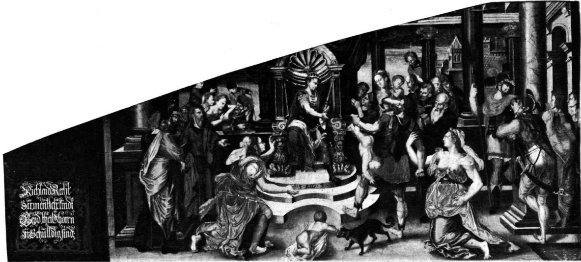
Abb. 1 Salomos Urteil, von H. Mareschet, 1584–1586. Aus dem Berner Rathaus.

Auch eine Theateraufführung durfte nicht fehlen 3 . Im eigens zu diesem Anlaß verfaßten Festspiel bekräftigten die Erzengel Michael und Gabriel als Schutzengel der beiden Städte, sekundiert von den Tugenden Liebi, Trüw, Dapfferkeit und B'scheidenheit , die wieder hergestellte Freundschaft, gegen die Sathan und Lucifer und die Laster Nyd und Verbunst vergeblich opponierten. Dann belehrte der Schulmeister