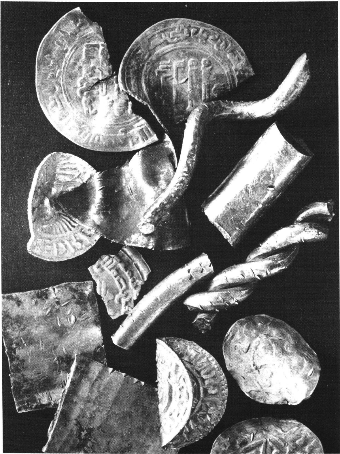
Abb. 1 Münzen und Hacksilber aus einem Fund von Karls, Tingstäde, Gotland. Links Fragmente von zwei islamischen Dirham. Rechts unten zwei deutsche Denare und ein (kräftig verbogener) englischer Penny.