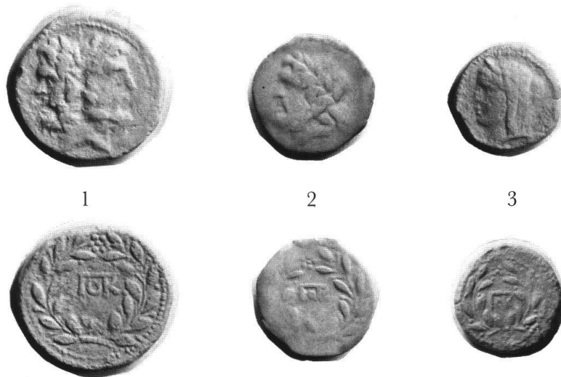
Abb. 4: Agrigent, Münzen des Beamten POR[CIVS]: Litra, Hemilitra und Tetras.