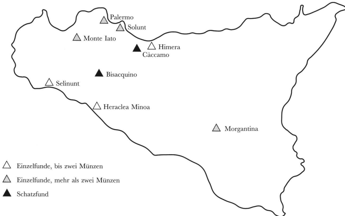
Abb. 3: Sizilien: Verbreitung der Münzen des Typs «Kopf des Zeus/Krieger» und ihrer Fraktionen.