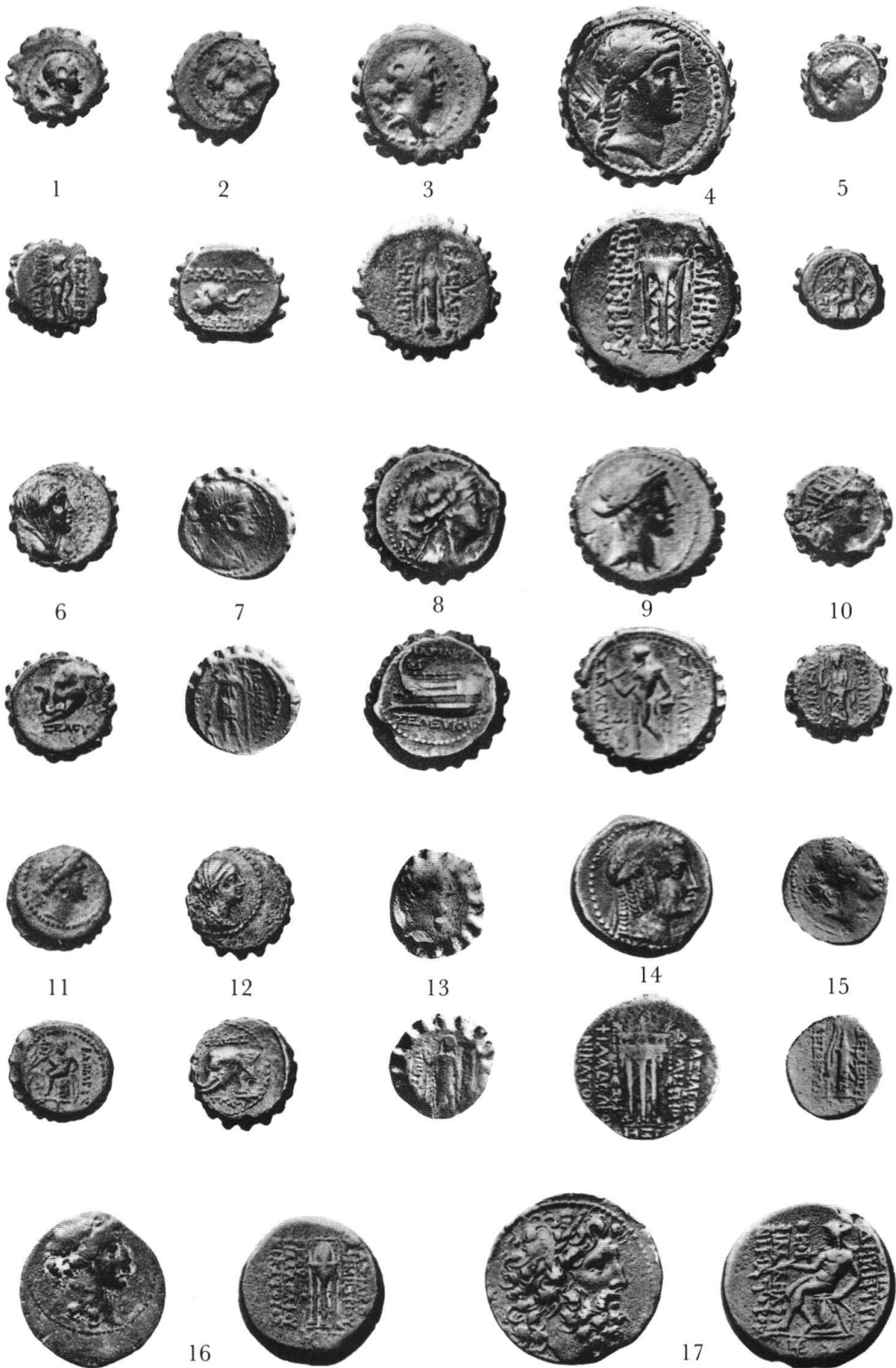
Thomas Fischer (†), Zu den Bronzemünzen des Demetrios I.