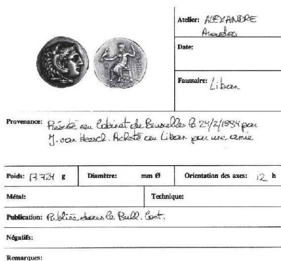
Fig. 4 Fiche du fichier des fausses monnaies conservée au Cabinet des médailles de Bruxelles