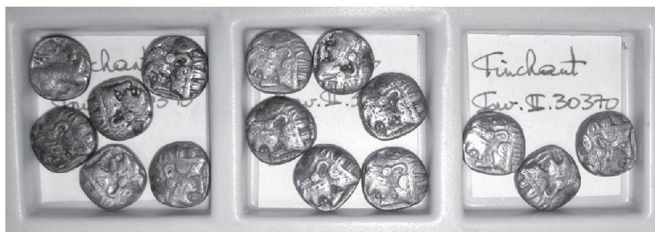
Fig. 2 15 des 38 drachmes moulées d'Athènes (Inv. II 30.370 – don Tinchant)

La collection de fausses monnaies grecques de Bruxelles a été exploitée de deux manières. On a d'une part veillé à toujours communiquer ses éventuels avoirs lors des réponses apportées à des demandes de matériel pour une étude de coins 8 . On a de l'autre fait connaître quelques études spécifiques issues en tout ou en partie de son examen 9 . Mais beaucoup reste à faire. Certaines séries offrent des suites fournies comme les tétradrachmes d'Alexandre le Grand (40 exemplaires) ou les didrachmes de Rhodes (21 distatères – en liaison peut-être ou sans doute avec la popularité de ces pièces qui ont longtemps passé pour les «trente deniers» payés à Judas pour la trahison du Christ). La collection compte aussi 38 drachmes de chouettes athéniennes, toutes moulées à l'identique (Tinchant II 30.370 – 20 août 1937) (Fig. 2).