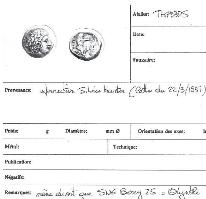
Fig. 6 Fiche du fichier des fausses monnaies conservée au Cabinet des médailles de Bruxelles

Une autre fiche indique sobrement: « information Silvia Hurter (lettre du 22/3/1997) ». Elle reproduit une mule combinant le revers d'un statère de Thasos et, au droit, une tête d'Apollon d'Olynthe (Fig. 6).