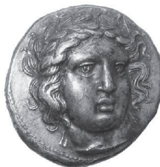
Inv. II 38.450 (don Tinchant – 13,54g, 3 h, 24 mm)