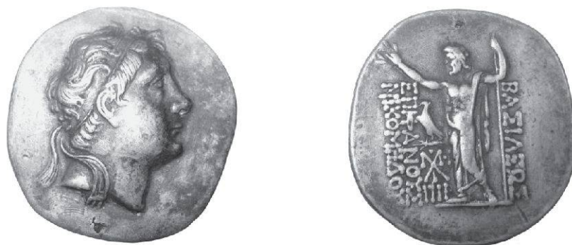
Fig. 3 Don Tinchant, sans date, 16,83g, 6 h, 36 mm

avait-il par exemple déclassé comme contrefaçon moderne dans les années 1930 un faux Caprara au nom de Nicomède de Bithynie, bien identifié comme tel par Philip Kinns dans sa monographie de 1984 mais qui aura entretemps beaucoup abusé d'esprits si l'on en juge par les publications de collections publiques et privées qui n'y ont pas vu malice ( Fig. 3 ) 10 .