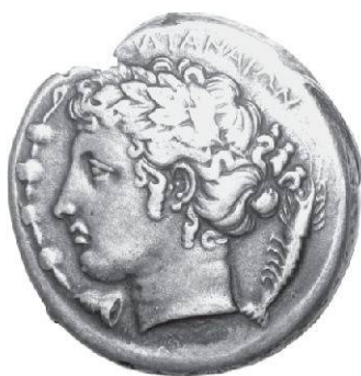
Fig. 1 Inv. II 80.482 (don Franceschi – 16,88 g, 6 h, 25 mm)

La qualité des faux va du plus sommaire, en l'occurrence d'épaisses imitations coulées dans le bronze d'originaux en argent, jusqu'au plus redoutable (souvent en provenance des faux mis de côté par les Franceschi) ( Fig. 1 ).