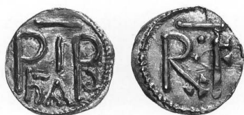
Abb. 6 Pippin III. der Kurze, hAd-PIP-Denar, Staatliche Museen zu Berlin, Inv. 18245614 https://ikmk.smb.museum/object?id=18245614 .

Es fällt jedoch auf, dass in der gesamten karolingischen Münzprägung kein weiterer Fall bekannt ist, in dem auf einer Münzlegende ein ad oder had vor einen Prägeortsnamen gestellt worden wäre. Das einzige weitere Mal, wo had auf einer karolingischen Münze erscheint, ist auf einer Prägung Pippins III. des Kurzen (751–768) 22 . Doch dort kommt es in Verbindung mit dem Herrschernamen vor, wobei die gesamte Legende als hAd PIP(INVS) zu lesen ist (Abb. 6). Es handelt sich um eines der frühesten Beispiele von karolingischen Minuskeln. Depeyrot interpretierte das had als Münzstätten-Abkürzung und ordnete die Prägung in der auf dem HAD-TVRECVM-Denar fussenden Annahme, dass dies eine nicht mehr bekannte Abkürzung für die Münzstätte Zürich sei, ebendieser Münzstätte zu 23 . Doch spricht gegen eine solche Interpretation nicht nur, dass had sonst in keiner Weise mit Zürich in Verbindung gebracht werden kann: Herrschernamen und Münzstätte finden sich weder unter Pippin noch unter seinen Nachfolgern auf derselben Seite der Münze.