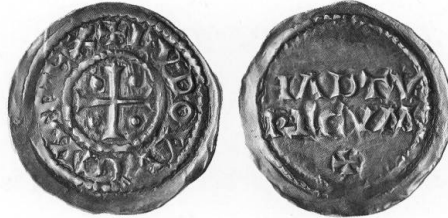
Abb. 2 HAD-TVRECVM-Denar im Schweizerischen Nationalmuseum, Inv. M-6675 (1,64 g).

Die Herkunft dieses Exemplars kann leider nicht weiter zurückverfolgt werden, da keine älteren Nachweisakten oder Inventare dazu vorliegen 3 .