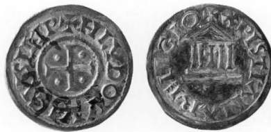
Abb. 7 Ludwig der Fromme, XPISTIANA-RELIGIO-Denar aus dem Zuidbarge-Hortfund, Drents Museum, Inv. 1860.04.

nicht nur für Ludwig den Frommen, sondern ebenso für alle anderen Kaiser namens Ludwig, insbesondere aber für Ludwig den Deutschen, der ja gar nie Kaiser war. Tatsächlich scheint aber kein einziges weiteres publiziertes Stück mit dieser Vorderseitenlegende zu existieren 38 . Es ist davon auszugehen, dass im Katalog schlicht das falsche V verdoppelt worden ist, was aufgrund der fehlenden Abbildungen leider nicht überprüft werden kann. Es kann sich aufgrund der (emendierten) Legenden somit sowohl um einen Denar Ludwigs des Frommen als auch Ludwigs II. von Italien handeln. Für Ludwig II. von Italien würde sprechen, dass Schierbeek alle pauschal als denari scodellati ( silbere Halfbracteaten ) mit Durchmesser von 31 bis 32 mm beschreibt 39 . Doch da andere Münzen aus dem Zuidbarge-Hortfund ebenfalls keine denari scodellati sind, kann diese Umschreibung nicht für alle Zuidbarge-Münzen beim Wort genommen werden. Dass die Zuweisung zu Ludwig dem Frommen stimmt, kann glücklicherweise am Original überprüft werden, das im Drents Museum unter der Inventarnummer 1860.04 aufbewahrt wird ( Abb. 7 ) 40 . Es deutet somit alles darauf hin, dass der vollständige Zuidbarge-Hort in jener Auktion in Groningen verkauft worden ist.