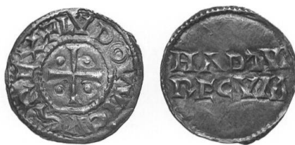
Abb. 1 HAD-TVRECVM-Denar in der Bibliothèque nationale de France, Inv. CAR-1539 https://gallica.bnf.fr/ark:/12148/btv1b104138004 (1,52 g).

Der hier angesprochene Münztyp trägt auf der Vorderseite ein Tatzenkreuz mit je einer Kugel in allen vier Winkeln, umgeben von einem Perlkreis und darum der Legende + LVDOVVICVS REX, ebenfalls im Perlkreis. Die Rückseite wird von zwei Zeilen horizontaler Schrift eingenommen: HAD TV/RECVM, auch diese im Perlkreis.