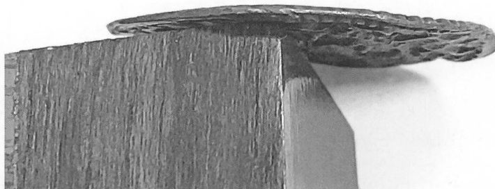
Abb. 3 Rand des HAD-TVRECVM-Denar in der Bibliothèque nationale de France 5 .

Neben diesem Exemplar, das sich heute unter der Inventarnummer CAR-1539 in der Sammlung der Bibliothèque nationale de France befindet, existiert heute unter Inv. M-6675 ein zweites Exemplar im Schweizerischen Nationalmuseum in Zürich (Abb. 2). Das Zürcher Exemplar wurde am 15. September 1932 bei Julius Cahn in Frankfurt a. M. ersteigert 4 und am 10. Oktober 1932 inventarisiert. Es befand sich zuvor im fürstlich-fürstenbergischen Münzkabinett zu Donaueschingen. Wann es in diese Sammlung Aufnahme gefunden hat oder Hinweise auf weitere Provenienzen sind dort hingegen nicht ersichtlich. Im Gegensatz zum Pariser Exemplar trägt das Zürcher Stück unter der Rückseitenlegende ein kleines Tatzenkreuz, die Machart des Schrötlings (Fabrik) entspricht – auch dies ein Unterschied zum Exemplar in der Bibliothèque nationale de France – der norditalienisch-spätkarolingischen Tradition mit breitem Rand (denaro scodellato). Es ist jedoch gut möglich, dass auch das Pariser Exemplar ursprünglich einen breiteren Rand hatte, der dann nachträglich befeilt worden wäre (Abb. 3). Das mit 1,52 g geringere Gewicht als jenes des Zürcher Exemplars (1,64 g) würde zwar dazu passen, die spätkarolingischen Denare norditalischen Stils schwanken jedoch allgemein stark im Gewicht.