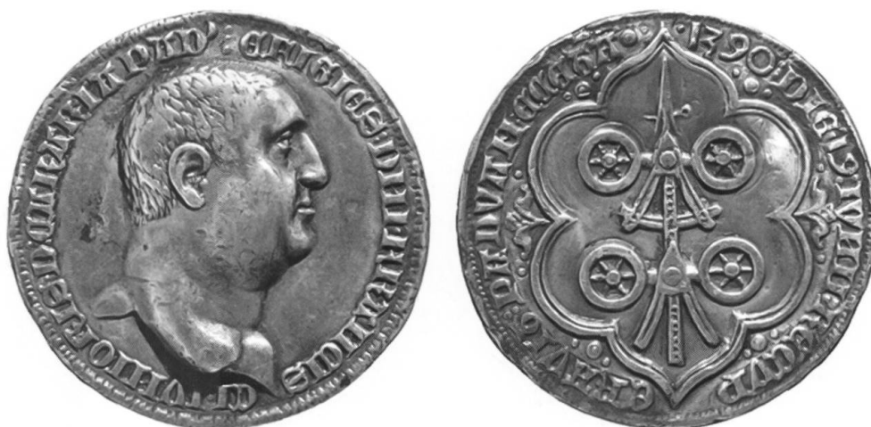
Fig. 11 Francesco II, medaglia per la riconquista di Padova nel 1390, con suo ritratto; argento (1,5x); Padova, Museo Bottacin.

I volti delle due figure non sono affatto fisionomici, come dimostrano alcuni affreschi contemporanei, dove Francesco I e II da Carrara appaiono sempre barbuti e con un viso affilato (v. sopra, Fig. 2 ), non paffuto come nelle medaglie 41 . Gran parte degli autori ha ritenuto che i volti della medaglia siano stati ispirati da Vitellio 42 , l'imperatore romano da cui si diceva discendessero i carraresi, secondo un legenda probabilmente già nota nel XIV secolo 43 . Questa tesi come vedremo subito è accettabile, ma è stata messa recentemente in discussione da Sylvia Do-