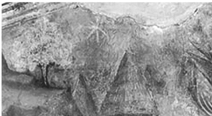
Fig. 9 Jacopo da Verona, L'Adorazione dei Magi, affresco (1397), corteo dei signori da Carrara (particolare con la cometa); Padova, Oratorio di San Michele.

Dunque la figura che apre il corteo è Francesco II e quella con le comete nella veste potrebbe essere proprio il padre Francesco I, confermando così pienamente quanto abbiamo ipotizzato sopra riguardo al suo programma iconografico sulle monete, tutto incentrato sulla celebrazione delle origini della Signoria e sulla rinascita della stessa nel 1337, rinascita annunciata dalla cometa. Di questo programma si fece poi evidentemente carico lo stesso Francesco II, portandolo forse ad un livello ben più alto di rappresentazione. Non possiamo nasconderci, infatti, che tutta la scena dell'Adorazione dei magi nell'oratorio di San Michele sembra avere la stessa chiave di lettura di quei lacerti iconografici presenti sulle monete del padre. Basti pensare che i magi non solo erano «re», ma anche si fecero guidare proprio da una cometa, presente anche nell'affresco ( Fig. 9 ).