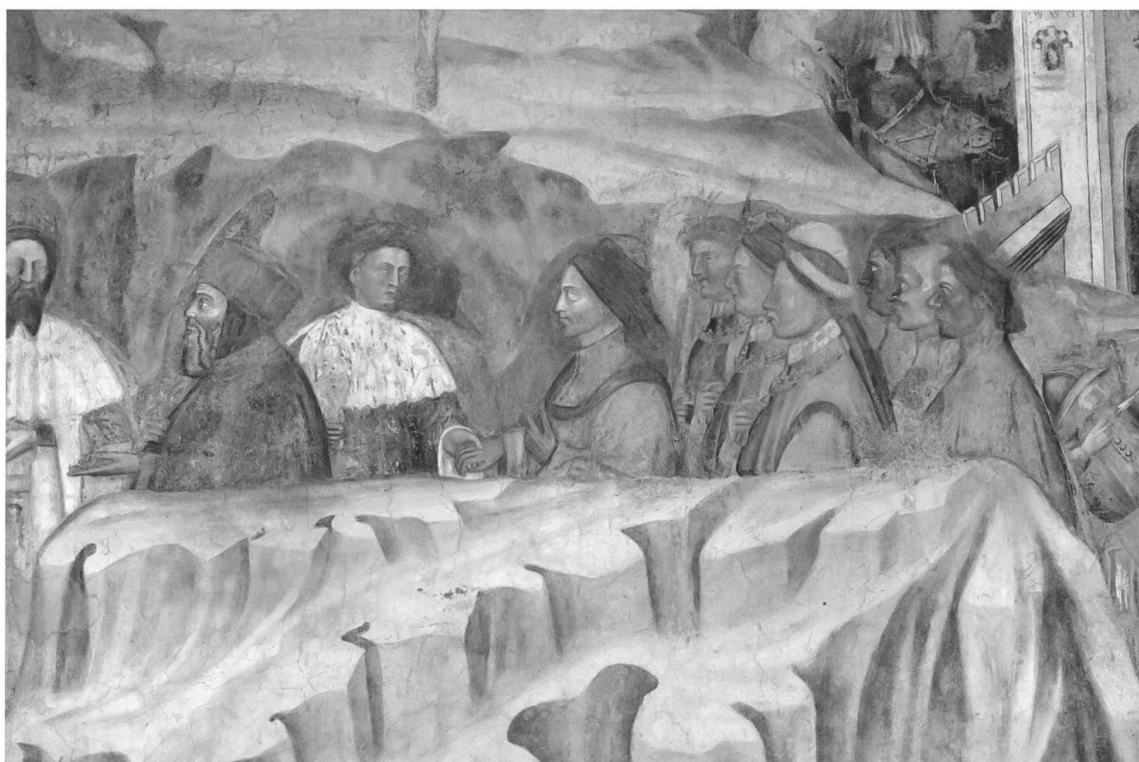
Fig. 4 Jacopo da Verona (1355– post 1443), L'Adorazione dei Magi, affresco (1397), (particolare con il corteo dei signori da Carrara); Padova, Oratorio di San Michele.

personaggio). Nel suo insieme l'immagine della moneta sembra più un primitivo ritratto all'antica, che potrebbe anche evocare un sovrano regnante, quale in effetti potrebbe considerarsi lo stesso Francesco, data la natura «regia» di Padova testimoniata anche dalle fonti agiografiche di cui abbiamo detto: forse un piccolo esperimento di rappresentazione ideale dello stesso Francesco, nel tentativo di far rivivere, con lo schermo della figura del moro, temi propri della monetazione romana? Entrambe le monete illustrate sopra erano rivolte al mercato del piccolo scambio, quindi con poca possibilità di veicolare direttamente un programma iconografico di celebrazione del potere. E' quindi probabile che si sia trattato invece di un esperimento per verificare se simili impegnativi concetti (Padova come feudo di diritto regale?) potevano essere fatti circolare su documenti ufficiali senza provocare reazioni troppo negative in quanti avevano forse il potere di bloccarli sul nascere. Comunque, sia, con il successore di Francesco, il figlio Francesco II 23 , tali programmi sono stati sicuramente portati avanti, ma in modo così spettacolare da far quasi dubitare che possano essere stati anticipati da esemplari monetali quasi insignificanti. Tuttavia non si può negare che il tema della cometa e della regalità è alla base della bellissima scena dell'Adorazione dei Magi negli affreschi dell'oratorio di San Michele a Padova, realizzati da Jacopo da Verona nel 1397 ( Fig. 4 ).