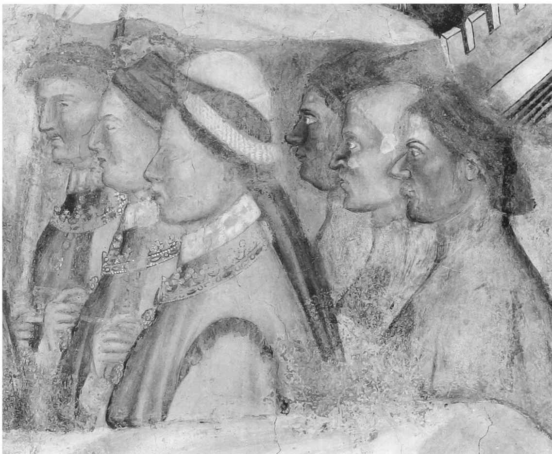
Fig. 7 Jacopo da Verona, L'Adorazione dei Magi , affresco (1397), corteo dei signori da Carrara (particolare con i primi 6 signori: Iacopo I, Marsilio, Ubertino, Marsilietto, Iacopo II, Iacopino); Padova, Oratorio di San Michele.

La figura risulta inoltre molto grossa e pesante, e dal colorito molto scuro, tutte caratteristiche che le fonti attribuiscono invece al figlio Francesco II 31 . Allo stesso tempo la figura alle sue spalle, che dovrebbe essere Francesco II, non è né grossa né scura, e soprattutto ha una corta barba rossiccia. La questione quindi sembra ridursi al dilemma se sono più importanti da un lato l'età e le vesti indossate, dall'altro l'aspetto fisico, per riconoscere un certo personaggio in una raffigurazione. Visto che le vesti, quelle simbolo di regalità, possono passare facilmente di padre in figlio, la risposta sembrerebbe ovvia, ma come spiegare l'insanabile contraddizione dell'età: il padre chiaramente più giovane del figlio? Non saremmo arrivati ad alcuna conclusione se non avessimo notato che i personaggi rappresentati nell'intero corteo, a parte i magi, sono 8, cioè i due riconosciuti come Francesco I e II, e poi altri 6 al seguito ( Fig. 7 ): l'esatto numero dei membri della dinastia carrarese che esercitarono la signoria.