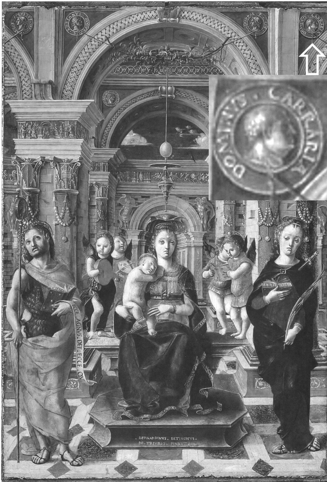
Fig. 13 Bernardino Butinone, Madonna con Bambino in trono e angeli tra i Santi Giovanni Battista e Giustina; particolare del tondo Dominus Carraria ingrandito; Collezione Borromeo, Isolabella (Varese ante 1485).