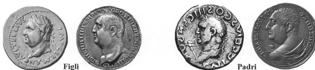
Fig. 12 Confronto fra le medaglie di Francesco II (figlio) e Francesco I (padre) da Carrara con i denari di Vitellio con il ritratto, rispettivamente, del Aulo Vitellio imperatore (Figlio) e Lucio Vitellio console (padre). Le monete e le medaglie sono state portate alla medesima dimensione ed alcune sono state ruotate sull'asse verticale per favorire il confronto.