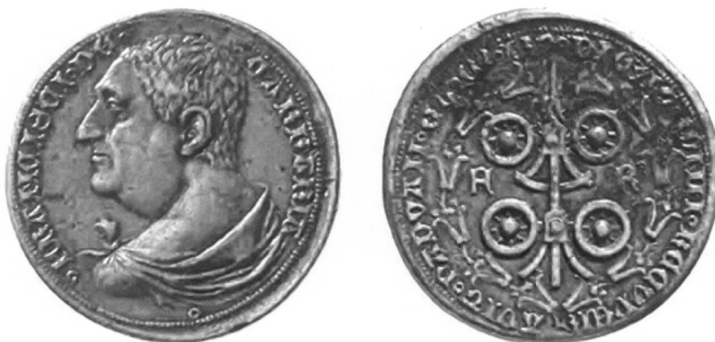
Fig. 10 Francesco II, medaglia per la riconquista di Padova nel 1390, con ritratto del Padre Francesco I, bronzo (1,5x); Padova, Museo Bottacin.