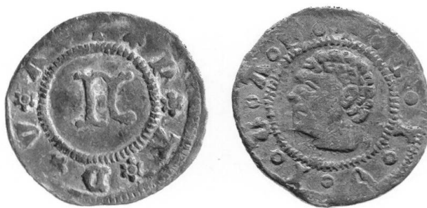
Fig. 3 Francesco I da Carrara, quattrino con la Testa di Moro (1387–1388) (2x); Padova, Museo Bottacin.

L'emissione del quattrino fu seguita, pochi anni dopo, da una moneta con la «testa di moro» e una grande F per Francesco, da me considerata un quattrino fortemente svilito e datato per questo al periodo 1386–1387 ( Fig. 3 ) 21 .