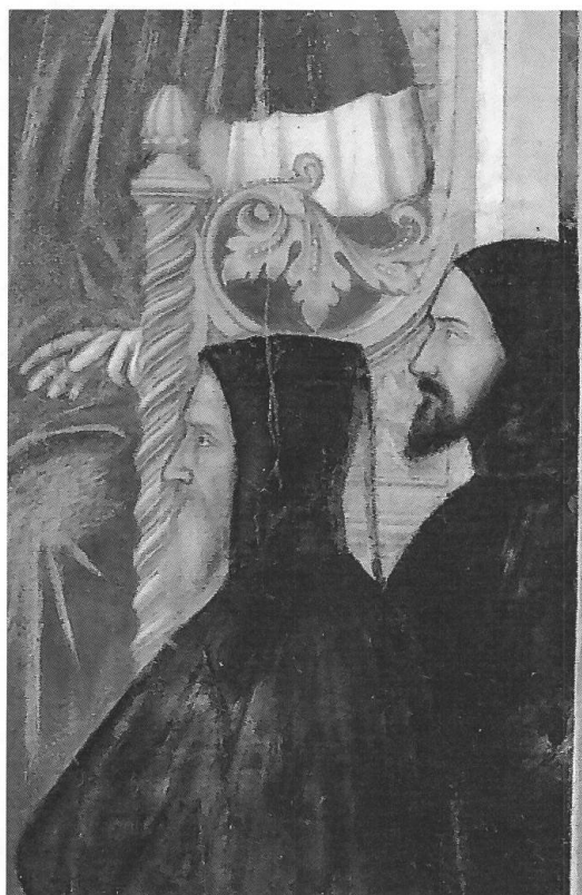
Fig. 6 Altichiero (1330 c. – 1390 c.), Santa Lucia davanti al giudice Pascasio, particolare con i ritratti di Francesco I (a s.) e II da Carrara; Padova, Oratorio di San Giorgio.

Questa identificazione dei due personaggi, proposta nel 1908 prima da Ezio Levi 26 e poi da Antonio Medin 27 , sembra poggiare su basi molto solide. Innanzitutto il personaggio a s. è sicuramente più vecchio del personaggio alle sue spalle, come effettivamente capita ai padri rispetto ai loro figli, in secondo luogo le vesti del primo corrispondono esattamente, soprattutto per la presenza dell'impresa del bue accompagnato dalla legenda MEMOR, a quelle di alcune descrizioni di Francesco I riportate dalle fonti 28 ; il personaggio a d., invece, porta nelle vesti l'impresa che allora si riteneva essere documentata solo sotto Francesco II. Qualche contraddizione invece esiste sicuramente fra le immagini e la descrizione dell'aspetto fisico dei due personaggi, quale si può ricavare da altri ritratti «sicuri» e dalle fonti. Innanzitutto la figura a s. ha una barba nerissima, solo leggermente brizzolata, che non si adatta affatto a Francesco I, che nelle altre rappresentazioni note, quella nella Cappella di San Felice nella Basilica del Santo 29 e quella nel vicino Oratorio di San Giorgio ( Fig. 6 ) 30 , affrescati più o meno un paio di decenni prima dell'Oratorio di San Michele, appare rossiccia e già molto imbiancata.