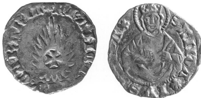
Fig. 1 Francesco I da Carrara, quattrino con Santa Giustina e cometa (1378–1388) (2x); Padova, Museo Bottacin.

Le mie ricerche in questo settore traggono spunto da una manifestazione iconografica minore: la presenza di una stella cometa al dritto di un quattrino ( Fig. 1 ), emesso a nome di Francesco I da Carrara (1355–1388) 6 ed oggi datato al periodo 1378–1386 7 , che aveva destato notevole curiosità in ambito numismatico. Infatti non era chiaro, essendo in precedenza questa emissione di difficile inquadramento cronologico, perché quel signore avesse introdotto un'immagine che non sembrava aver nulla a che fare con la tradizionale iconografia monetale dei carraresi, in precedenza basata essenzialmente su semplici legende, su raffigurazioni di natura religiosa o, più raramente, su stemmi signorili o civici 8 . In secondo luogo, perché per introdurre questa novità si era scelto un simbolo che nella cultura medievale, così come in quella antica, appariva in genere nefasto, soprattutto per quanto riguardava proprio la caduta di regni e regnanti? 9