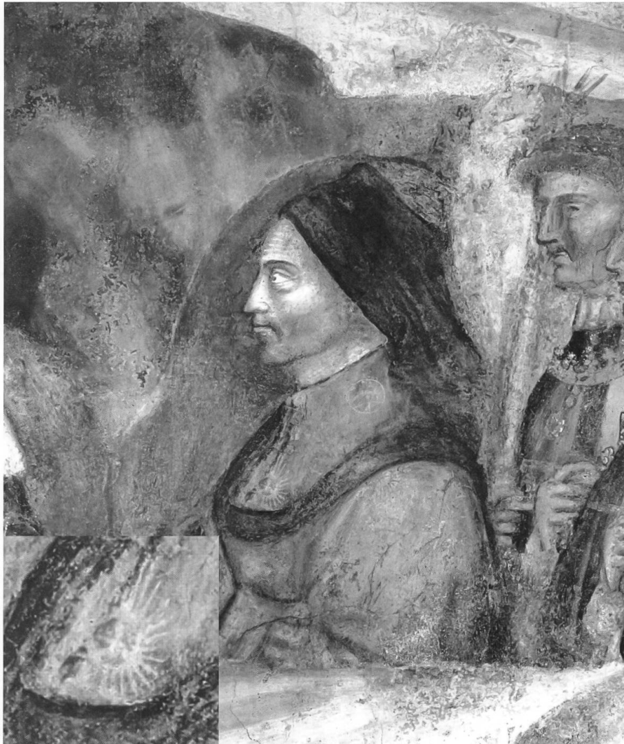
Fig 5 Jacopo da Verona (1355–post 1443) L'Adorazione dei Magi, affresco (1397), corteo dei signori da Carrara (particolare con Francesco I); Padova, Oratorio di San Michele.

Evidentemente le raffigurazioni monetali precedenti poggiavano su una base culturale ben più vasta di quanto immaginabile. A giudizio oggi unanime nel corteo sono raffigurati gli ultimi due Signori da Carrara e la loro corte 24 , ma l'identificazione de singoli personaggi appare piuttosto incerta. Il primo a s. viene identificato con Francesco I (settantaduenne all'epoca), quello che lo segue, tenuto per mano da uno dei «magi», il figlio Francesco II (allora trentottenne) E' proprio nelle vesti di quest' ultimo che è più volte rappresentata, in modo molto chiaro, l'impresa della cometa ( Fig. 5 ), assieme all'altra impresa della sfera armillare anch'essa documentata solo durante il governo di questo signore 25 .