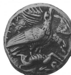
Lavinia Sole Un tesoretto dimenticato da Himera: Nuovi dati sul ripostiglio IGCH 2258