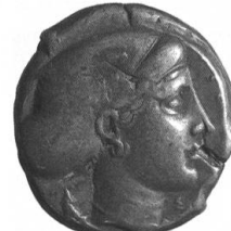
Lavinia Sole Un tesoretto dimenticato da Himera: Nuovi dati sul ripostiglio IGCH 2258