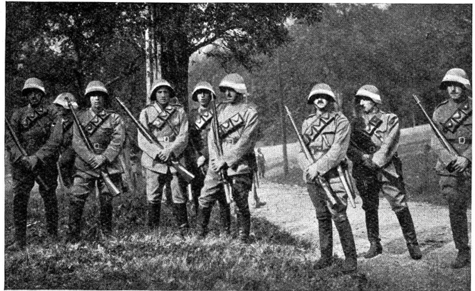
Kavalleriepostierung vor dem Feind.

Heute früh, beim Gewehrgriffübun, liess uns, alle zugleich, ein mächtiges Brausen die Köpfe in die Höhe heben. Ein grosses Geschwader — es waren ihrer zwanzig — zog in einem gewaltigen Bogen über die Stadt und das Exerzierfeld hin. Nun kreisten sie über uns, und deutlich hob sich, von den Strahlen der Sonne