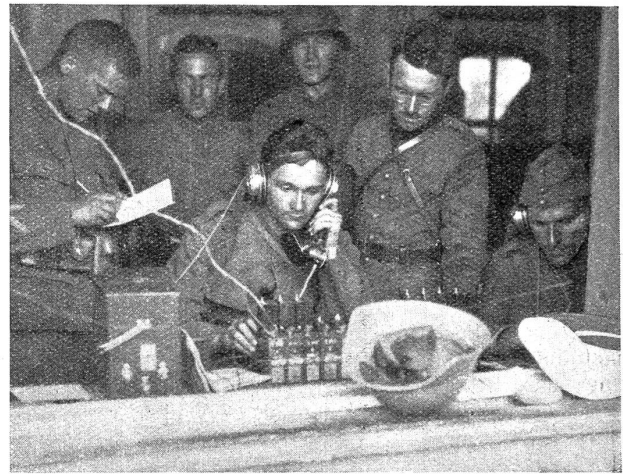
Betrieb in einer Telephonstation.

nössische Buss- und Betttag dazu benutzt worden ist, gegen unser Wehrwesen zu predigen, statt Gott und der Armee auf der Kanzel dafür zu danken, dass wir vom Weltkrieg verschont worden sind. Wir können uns