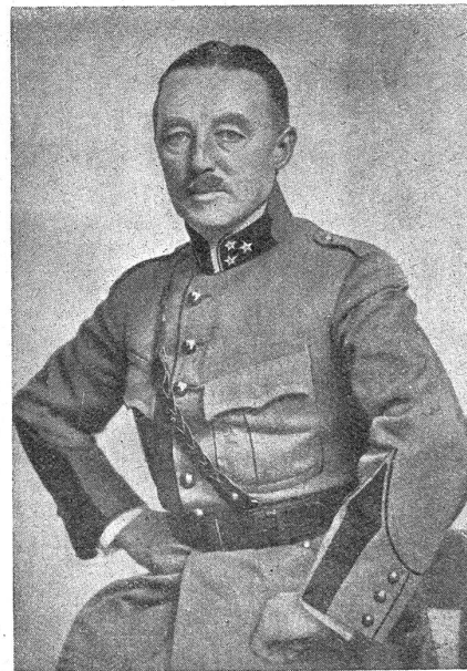
Oberst Henry Guisan, der neue Divisionskommandant 2.

Wir verweisen auf die Bilder der Genannten in dieser Nummer.