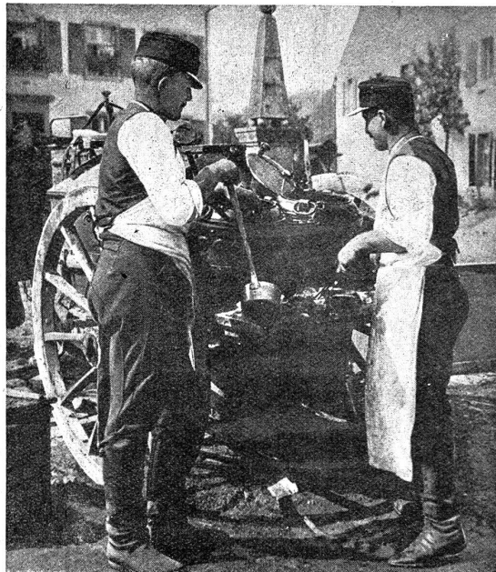
«Hier gibt's Spatz».

der ein sauberes Strässchen aufnimmt. Auf dem Strässchen hält die Spitze an, bis das ganze Bataillon aufgeschlossen ist, was reichlich 10 Minuten dauert. Nachdem alle den Wald verlassen haben, wird abmarschiert, und wir sind froh darüber, diese «Masurischen Sümpfe» hinter uns zu haben.