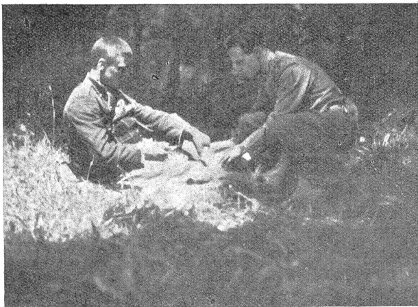
Der Arzt bei der Arbeit.