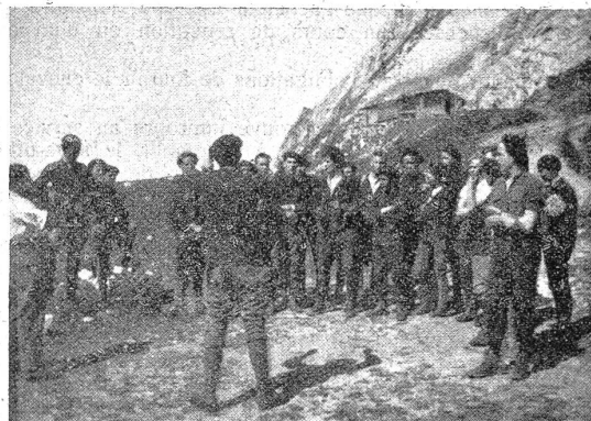
La Grande course de la Jungwehr Neuchâtel aux Rochers de Naye. Der Chor der Deutschschweizer.

b) les caporaux conducteurs ou du train, les sergents, fourriers et sergents-majors de l'artillerie ou du train qui ont encore à accomplir au moins 6 cours de répétition dans l'élite.