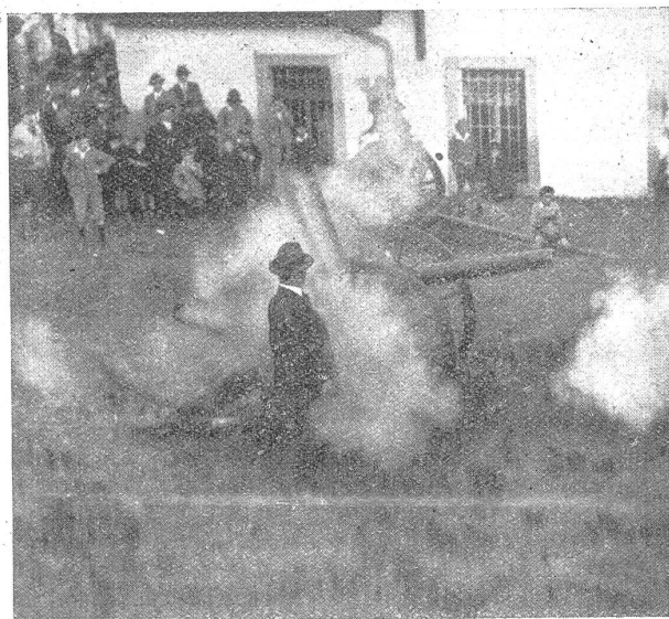
Der «Böllerschuss» am Knabenschieszen in Zürich.

den den Feind auf einer Krette süd-östlich Zofingen im Gebiete des Heiternplatzes. Es ist ihnen gelungen, festzustellen, dass der Feind schwächer ist als wir, jedoch zwei Geschütze besitzt. Wir beschliessen also die Offensive und greifen folgendermassen an: 1. Zug greift die linke Flanke des Feindes an. Dasselbe tun 3. und 4. Zug an der rechten Flanke desselben. Nun bleiben noch der 2. und 5. Zug, die wir beide frontal einsetzen. Nun kann der Kampf beginnen. Wir eröffnen gleich lebhaftes Gewehrfeuer, das uns der Feind mit Artillerie erwidert und uns zeigt, dass er auch nicht schlafe. Wir erzielen bald sehr gute Erfolge, denn es gelingt uns, bis zu der vom Feind besetzten Stelle vorzurücken. Unerwarteter Weise erhält er jedoch hier Verstärkungen, die es ihm ermöglichen, uns auf der ganzen Front zu werfen.