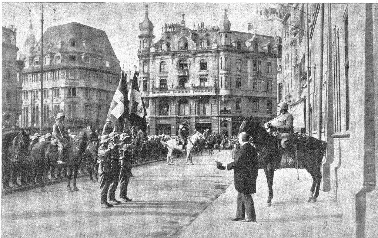
Fahnenübergabe der Basler. W. K. 1927.